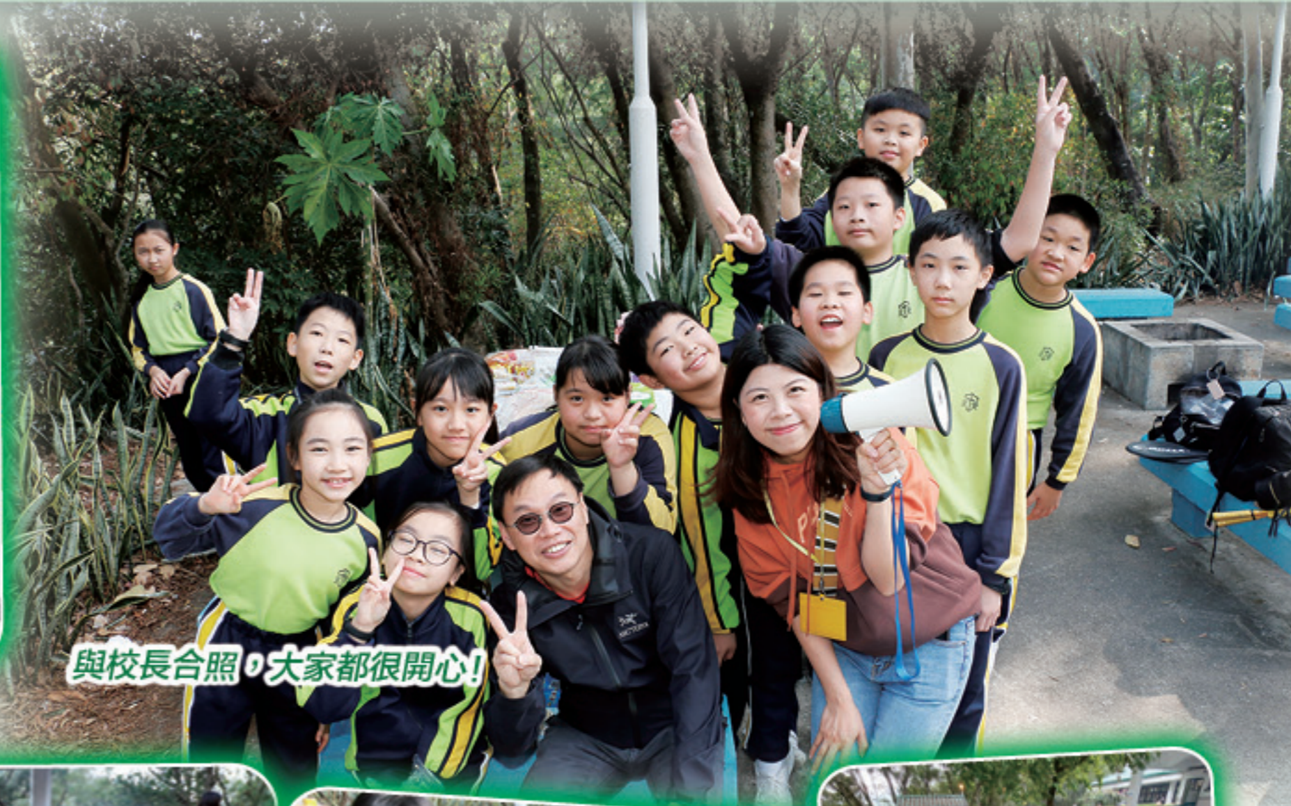
與校長合照，大家都很开心！