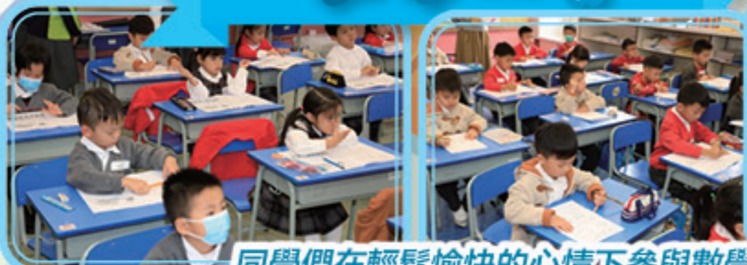
同學們在輕鬆愉快的心情下參與數學比賽。