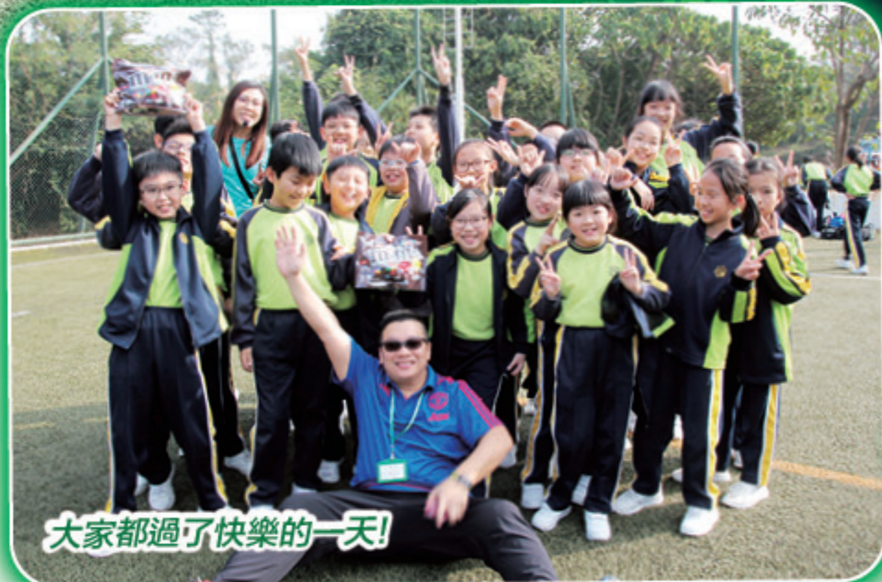
大家都過了快樂的一天！