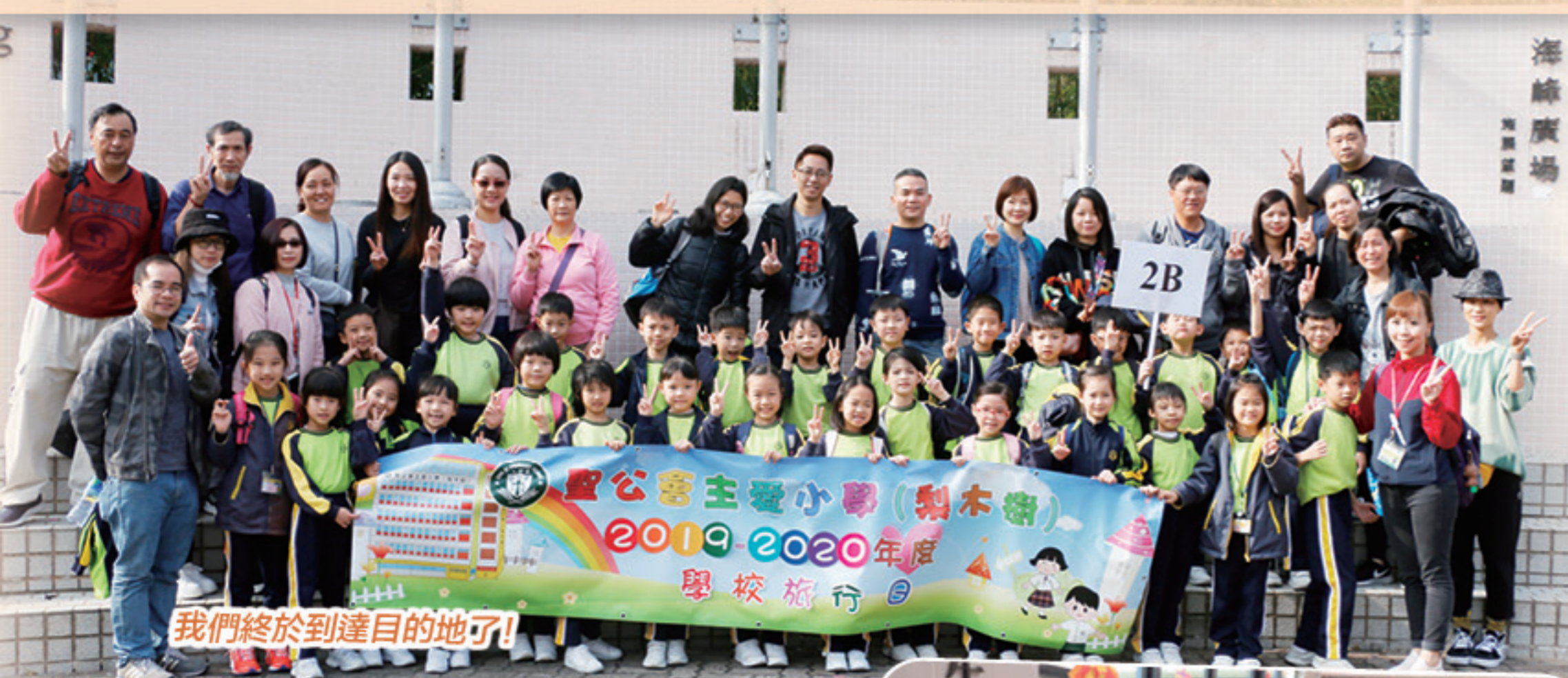
我們終於到達目的地了!

2020年1月22日(星期三)是本校一年一度的學校旅行，當天全校同學浩浩蕩蕩地乘坐旅遊巴，由學校出發前往位於元朗的保良局賽馬會大棠渡假村。大家置身大自然中，一同遊戲、野餐，看着綠葉成蔭的大樹，呼吸着清新的空氣，令人心曠神怡；同學們盡情地使用渡假村內各項設施，樂也融融。低年級的家長還和子女進行了親子遊戲，既有趣又刺激，家長和學生投入其中；而高年級同學則可跟三五知己，甚至是老師一起燒烤，大家都度過了輕鬆、愉快又難忘的一天。