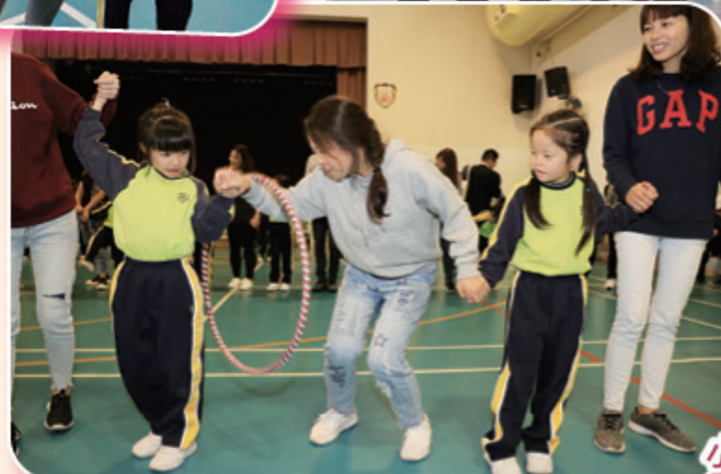
小朋友與家長合作無間呢!