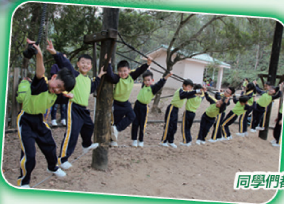
同學們都趁機舒展筋骨！