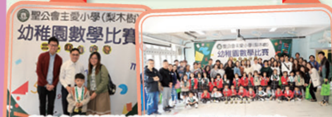
所有參與數學比賽的同學、家長及老師在本校留下倩影。