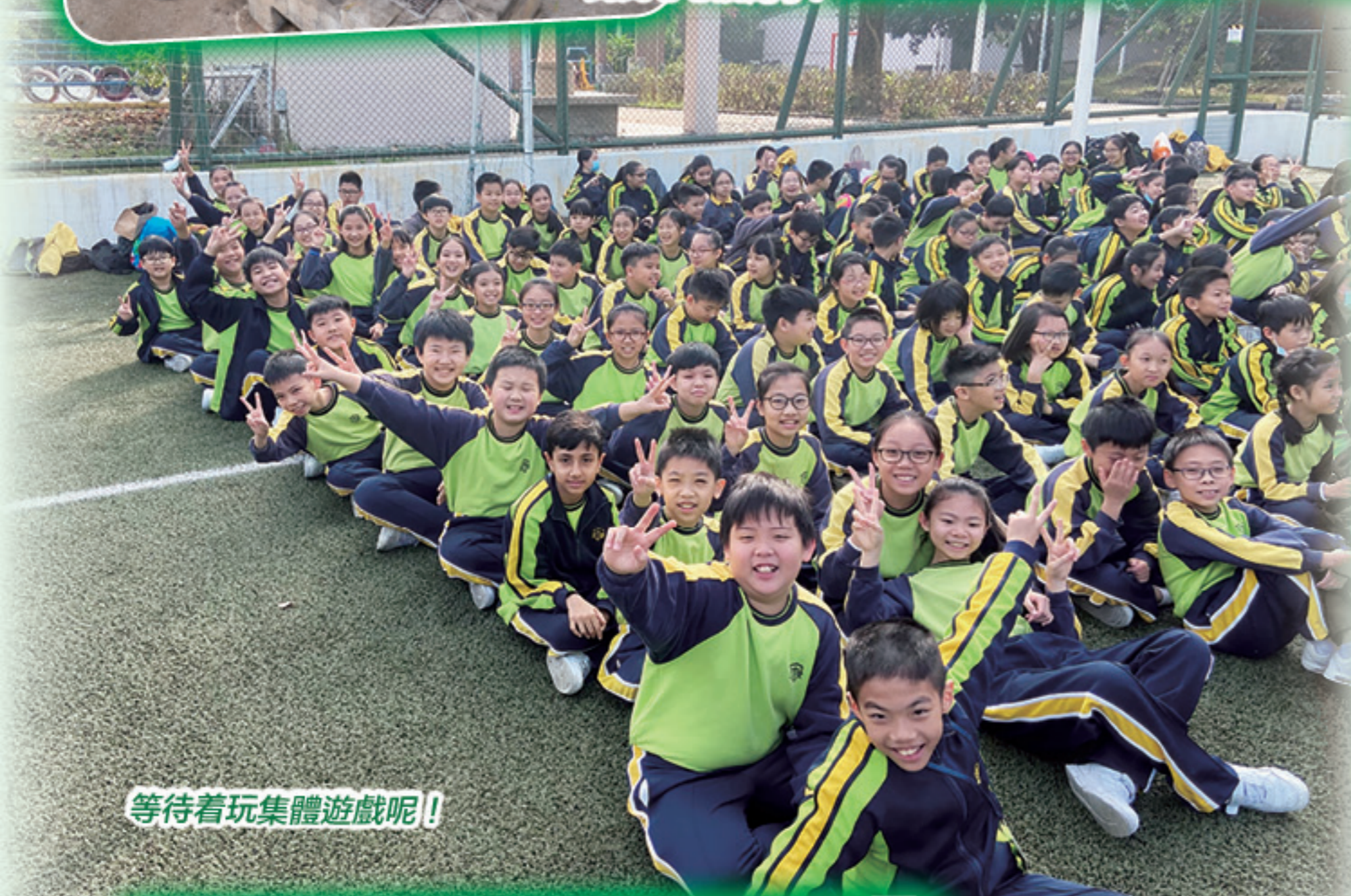
等待着玩集體遊戲呢！