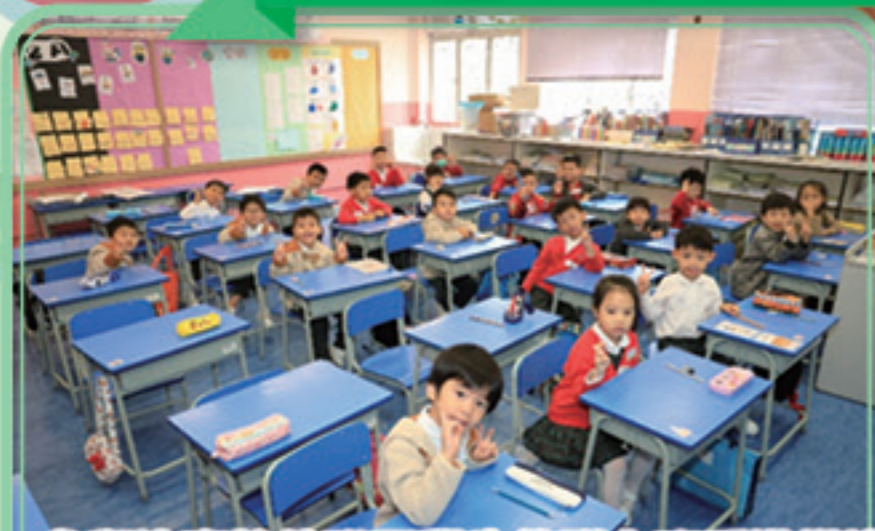
參與比賽的幼稚園學生集隊上班房準備比賽，大家都顯得精神奕奕。