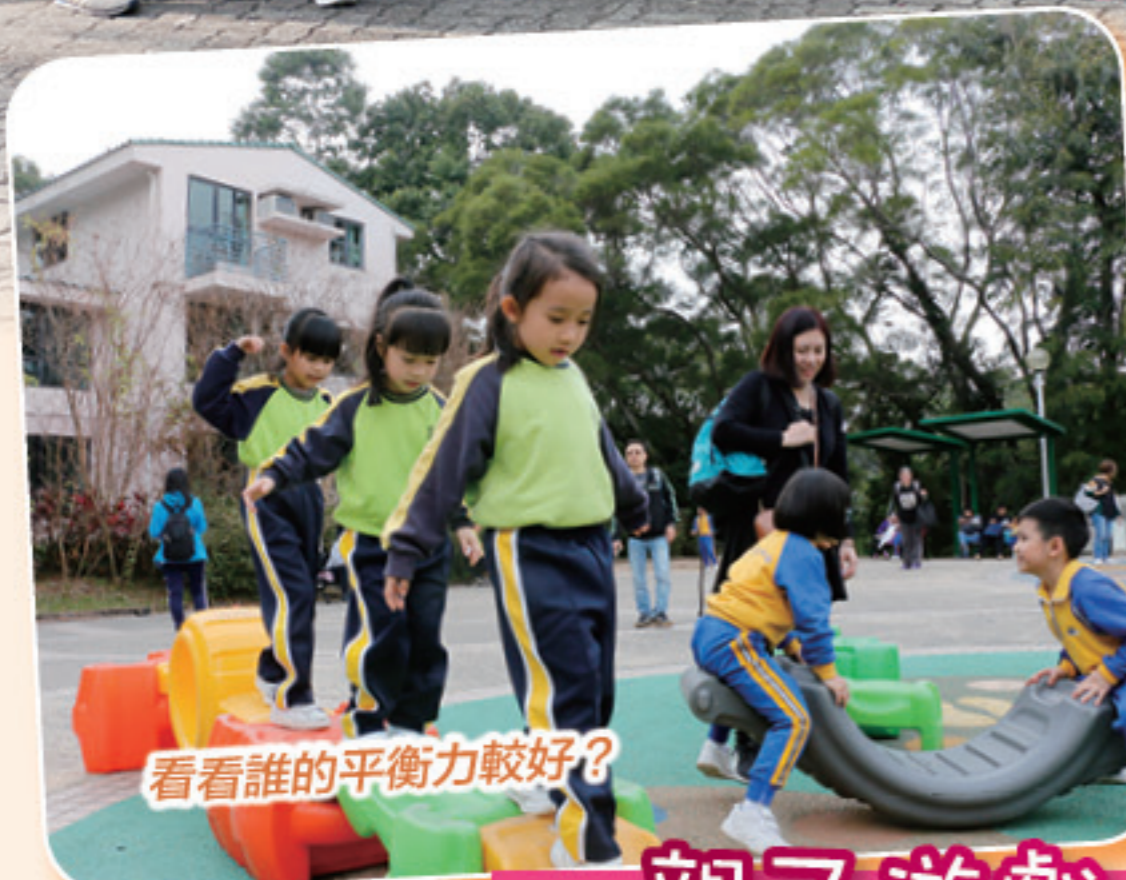
看看誰的平衡力較好?