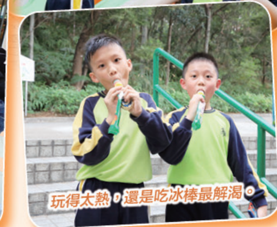
玩得太熱，還是吃冰棒最解渴。