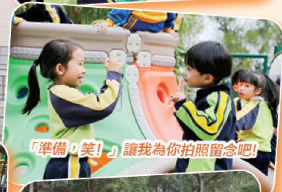
「準備，笑!」讓我為你拍照留念吧!