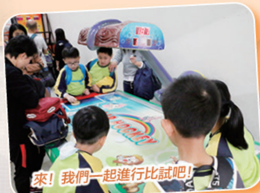
來! 我們一起進行比試吧!