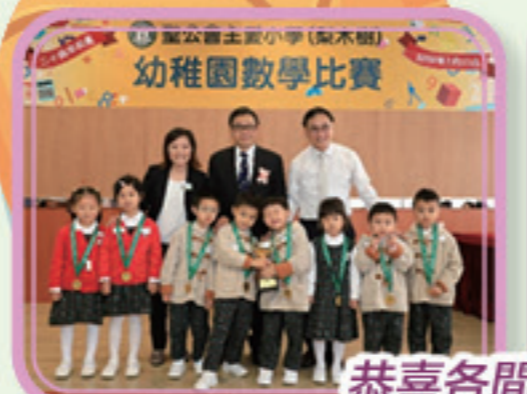
恭喜各間幼稚園學校的得獎者在比賽中獲得佳績。