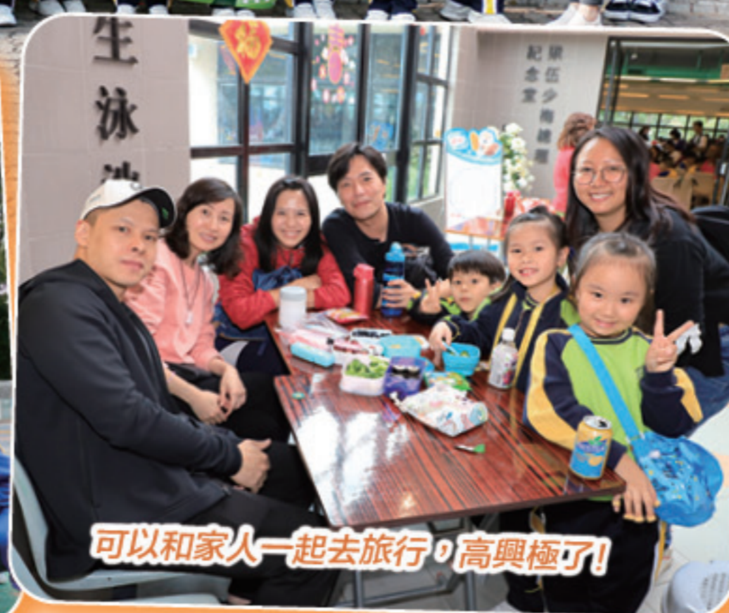
可以和家人一起去旅行，高興極了!