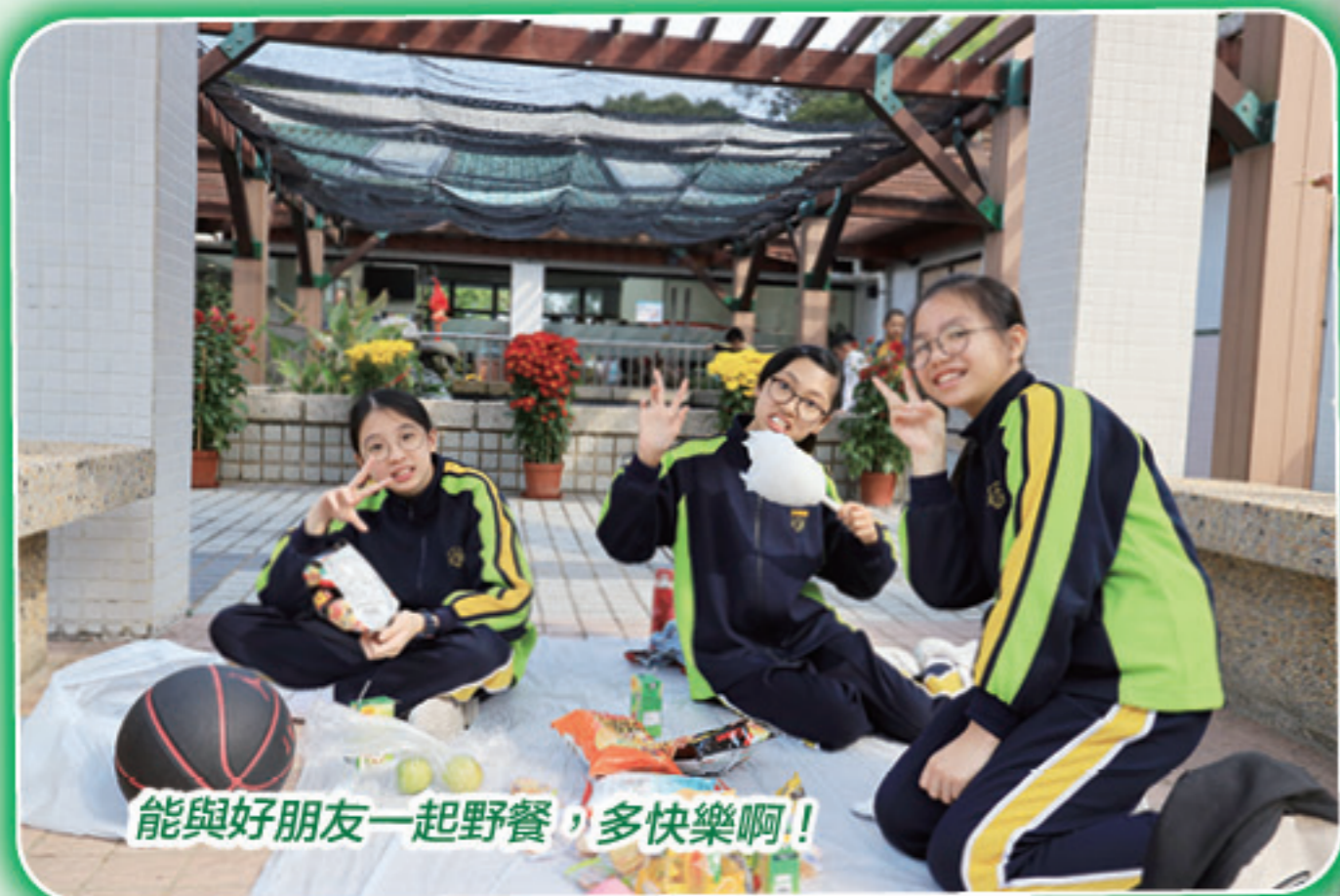
能與好朋友一起野餐，多快樂啊！