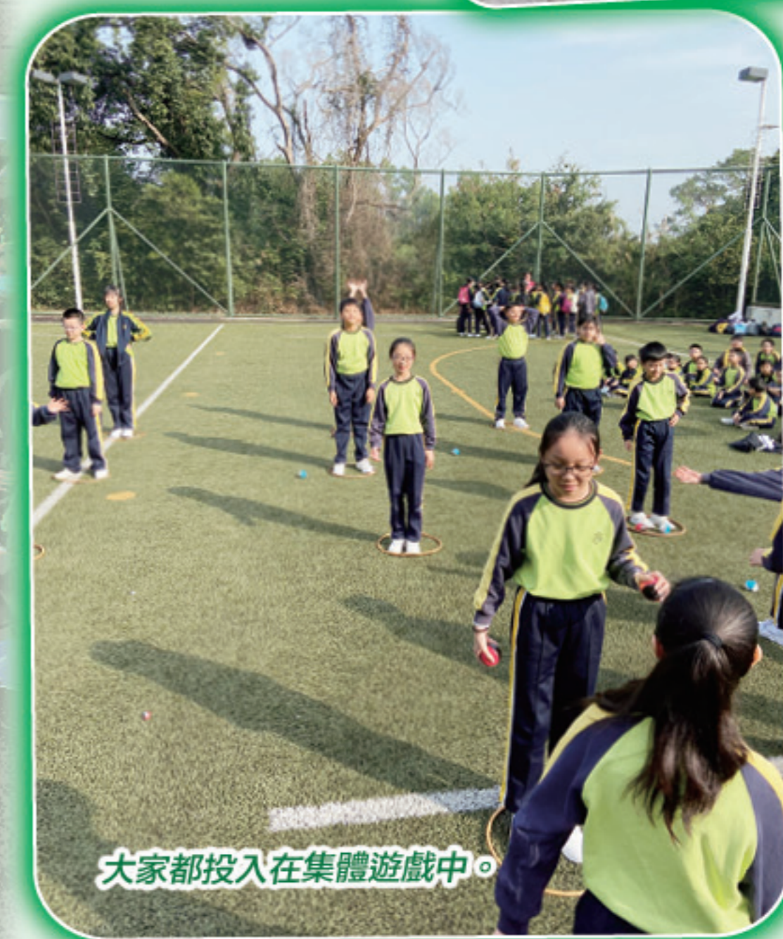
大家都投入在集體遊戲中。