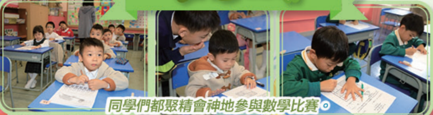
同學們都聚精會神地參與數學比賽。