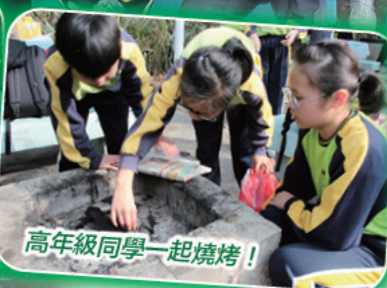
高年級同學一起烧烤！