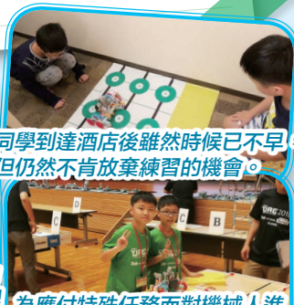
同學到達酒店後雖然時候已不早，但仍然不肯放棄練習的機會。