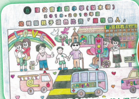
冠軍 K2 聖公會荊冕堂士德幼稚園 黃夕桐