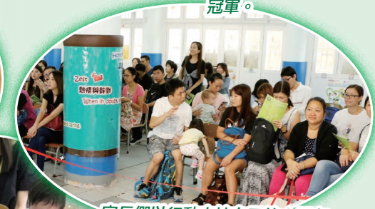
家長們以行動支持自己的小朋友。