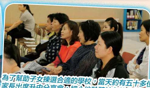
為了幫助子女揀選合適的學校，當天約有五十多位家長出席升中分享會，細心地聆聽校友的分享。