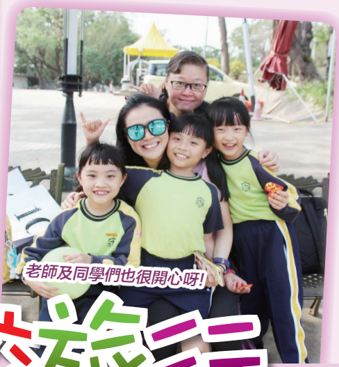
老師及同學們也很開心呀!