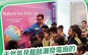
天然氣是龍鼓灘發電廠的主要發電能源。

於2018年10月19日(星期五)，五年級及六年級一行40人參觀位於屯門的龍鼓灘發電廠。透過參觀發電機組及巴士環廠遊，同學們能更加了解中電和本地電力產業的運作模式。