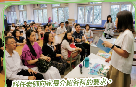
科任老師向家長介紹各科的要求。