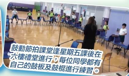
鼓動節拍課堂逢星期五課後在六樓禮堂進行，每位同學都有自己的鼓板及鼓棍進行練習。