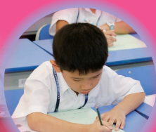
同學們很認真地學習呢！