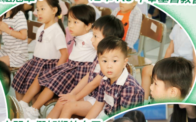
小朋友們都期待自己會得到甚麼獎項。