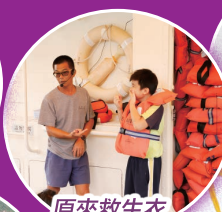
原來救生衣是這樣穿的。