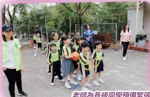
老師為各級同學預備緊張刺激的集體遊戲, 同學們都樂在其中。