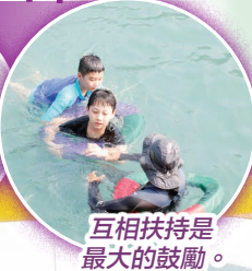
互相扶持是最大的鼓勵。