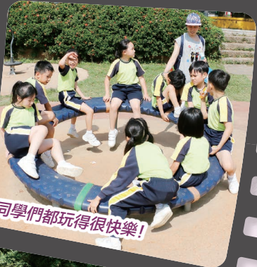
同學們都玩得很快樂!