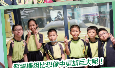
發電機組比想像中更加巨大呢!