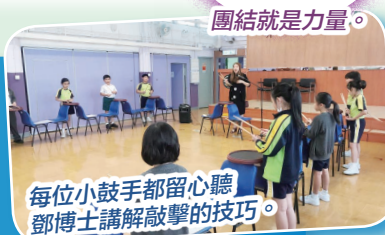
每位小鼓手都留心聽鄧博士講解敲擊的技巧。

報名參與鼓樂隊的人數眾多，老師最後挑選了20位三至五年級的同學參與鼓樂隊。鼓樂隊逢星期五課後進行訓練，在全年學習後，他們將作公開演出，與公眾分享全年學習成果，機會十分可貴!