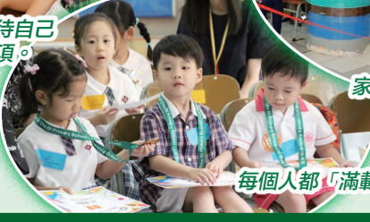
每個人都「滿載而歸」！