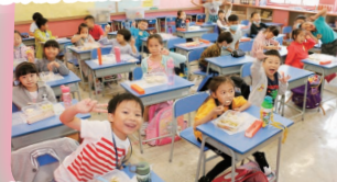
你看，同學們穿着便服的樣子是多麼的精神抖擻呢!