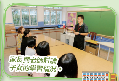
家長與老師討論子女的學習情況。