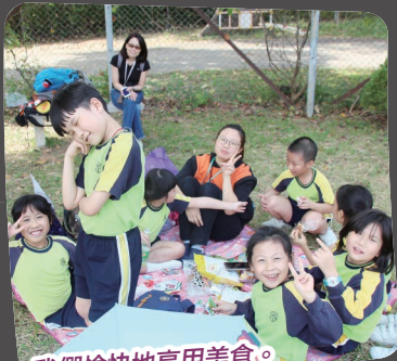
我們愉快地享用美食。