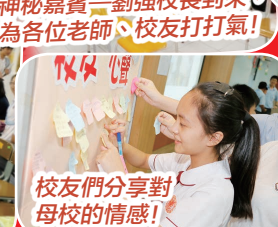
校友們分享對母校的情感！