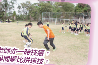
老師亦一時技癢, 與同學比拼球技。