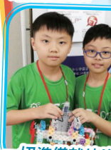
一切準備就緒！準備進入主場進行決賽。