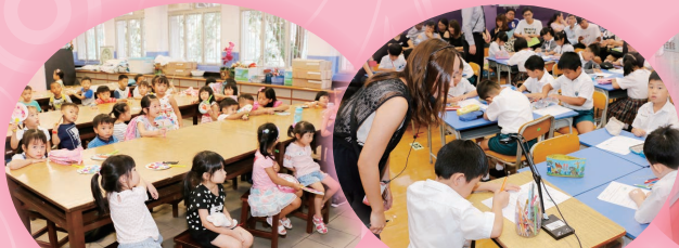
每位小朋友都有自己親手做的紀念品呢！