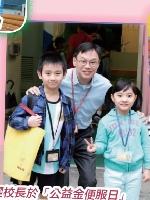
霍校長於「公益金便服日」活動中跟同學拍照留念。

一年一度的「公益金便服日」籌款活動於2018年10月11日(星期四)舉行。是次籌款目的乃為資助社會福利服務，培養學生主動關心和幫助他人的良好品德。是此活動得到家長和學生們的鼎力支持，共籌得港幣19,099元。