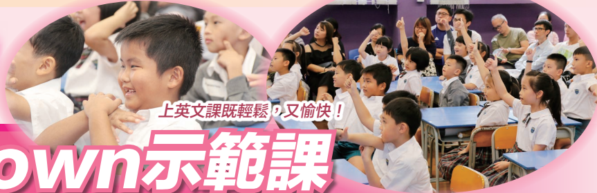
上英文課既輕鬆，又愉快！

本年度的校園開放日已於2018年9月8日(星期六)舉行，吸引了不少幼稚園及本校的家長到來參觀，從而加深對我校辦學宗旨及各科課程架構的認識。此外，為了讓家長更了解我校的英語課程，校園開放日當天還安排了「Space Town」英語課程的示範課。「Space Town」英語課程是一個由教育局及外籍英語教師組推行，以PLP-R/W為藍本，再加以改良的英文計劃。此課程生動有趣，深受老師、家長及學生歡迎。「Space Town」英語課程在我校已伸延至三年級，希望更多學生能發掘到學習英語的樂趣！