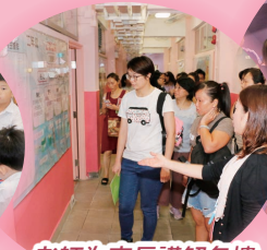
老師為家長講解各樓層壁報的特色。