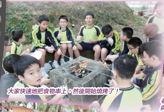
大家快速地把食物串上, 然後開始燒烤了!