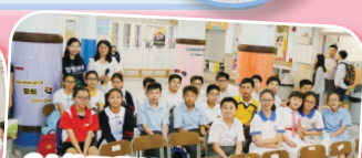
6A的同學精神抖擻，聚首一堂！