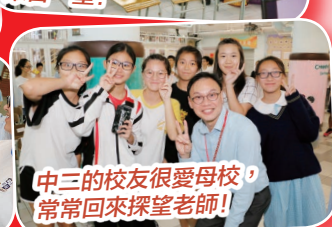
中三的校友很愛母校，常常回來探望老師！