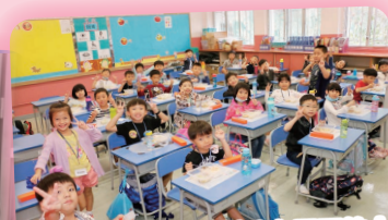
同學們既可以籌款幫助有需要的人，又可以穿便服回校上課。