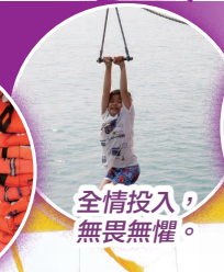
全情投入，無畏無懼。