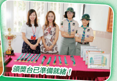
頒獎台已準備就緒！