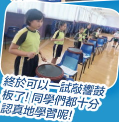
終於可以一試敲響鼓板了!!同學們都十分認真地學習呢!