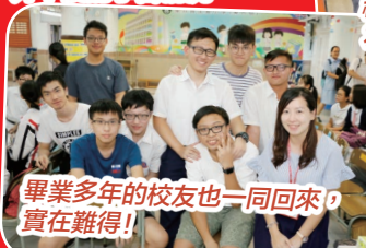
畢業多年的校友也一同回來，實在難得！