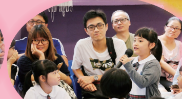
同學勇於回答問題。