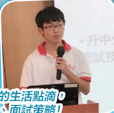
師兄師姐們熱心地分享他們中學的生活點滴，細心地為同學們講解學校的特色、面試策略！