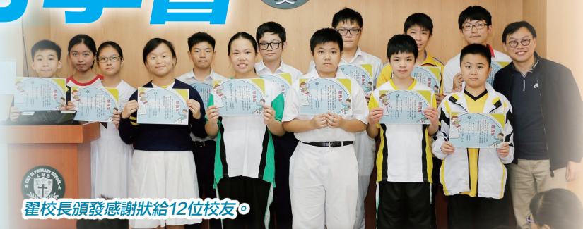
翟校長頒發感謝狀給12位校友。

十二位校友(分別就讀於荃灣官立中學、荃灣公立何傳耀紀念中學、喬色園主辦可風中學、中華傳道會安柱中學、寶安商會王少清中學、廖寶珊紀念書院、博愛醫院歷屆總理聯誼會梁省德中學及保祿六世書院)於2018年11月10日(星期六)下午回到本校分享。