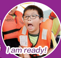
I am ready!

為了提升學生的自信心，讓他們學習互相合作，培養彼此扶持的態度，本校於2018年10月9日(星期二)參加由「乘風航」舉辦的「結伴同航」訓練計劃。當日共有54名風紀參與活動，在導師的帶領下，學生在「賽馬會歡號」進行了多項訓練，如救生艇操作及棄船逃生演習等。除了讓學生學習海上求生的知識外，亦訓練學生膽量，讓他們有勇氣面對日後生活上所遇到的種種挑戰。活動結束後，各同學均表示活動十分有意義，同學間互相支持及鼓勵，令他們有信心衝破障礙，跨越困難。計劃帶給他們美好的回憶，令他們畢生難忘。