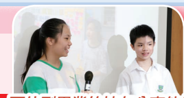
兩位剛畢業的校友分享他們升中後的學習情況。

一年一度的黃昏小聚於2018年9月28日(星期五)舉行，是次活動讓各校友與老師們有相聚的機會。透過畢業生的分享升中後的生活點滴，校長和師長們的勸勉，為各畢業生打氣，相信校友們定能重新得力。