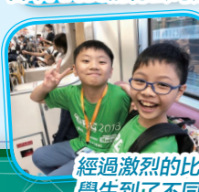
經過激烈的比賽後，學生到了不同的景點參觀。