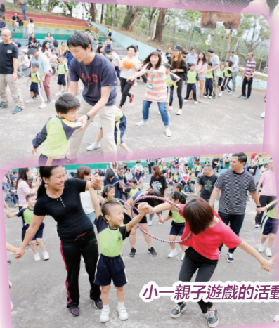
小一親子遊戲的活動情況, 學生、老師及家長樂也融融。