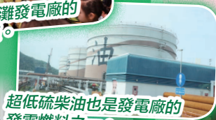
超低硫柴油也是發電廠的發電燃料之一。