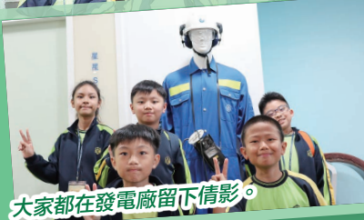
大家都在發電廠留下倩影。