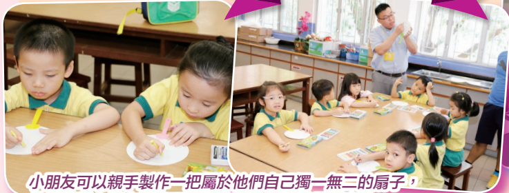
小朋友可以親手製作一把屬於他們自己獨一無二的扇子，他們很用心填上顏色，希望自己的扇子是最漂亮的。