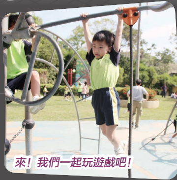
來! 我們一起玩遊戲吧!

本校於2018年11月9日(星期五)舉行全校旅行。當天天氣清涼，一至六年級的學生與家長們浩浩蕩蕩前往粉嶺浸會園。在園內，大家一起玩親子遊戲、集體遊戲及使用園內遊樂場各項設施，大人小孩都盡興而歸，相信這次旅行令各位同學也難以忘懷。