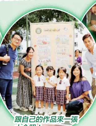
跟自己的作品來一張大合照！