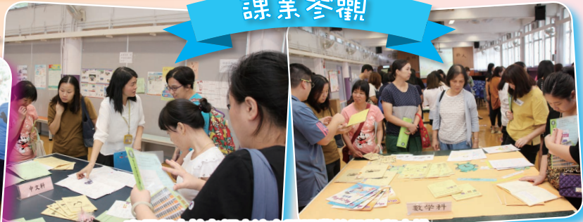
家長與本校老師交流有關課業的設計與安排。