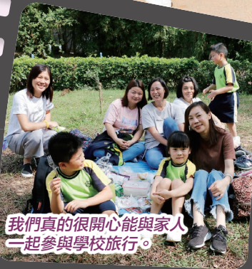
我們真的很開心能與家人一起參與學校旅行。