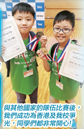
與其他國家的隊伍比賽後，我們成功為香港及我校爭光，同學們都非常開心！