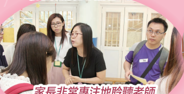
家長非常專注地聆聽老師對學生課業的講解。