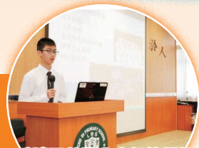
升讀了荃灣公立何傳耀紀念中學的師兄回校與學弟妹分享中二生活

為使家長及六年級同學更了解本區中學及升中選校事宜，本校於11月邀請了區內7間中學的校長或老師蒞臨本校，介紹中學的課程特色、課外活動、升學情況等，並與同學們分享升中選校策略及自行選校階段面試時要注意的事項。講座內容豐富，當中更有本校畢業生與其升讀的中學老師同來主持講座，與學弟學妹分享校園生活點滴，令同學聽得份外投入，獲益良多。參與講座的家長表示透過中學校長提供的資訊，有助他們日後與子女共同選擇合適的中學，並能為面試作出更好的準備。