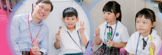
他們第一次在學校小息，除學習與人相處外，也可以享受與同學分享食物的樂趣。