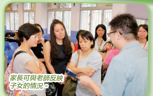
家長可與老師反映子女的情況。