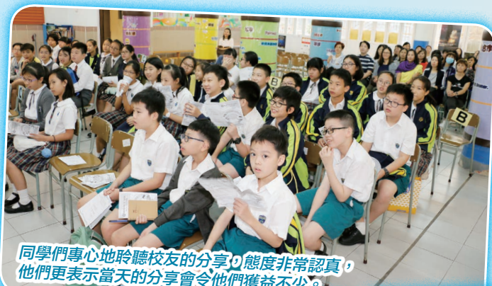
同學們專心地聆聽校友的分享，態度非常認真，他們更表示當天的分享會令他們獲益不少。