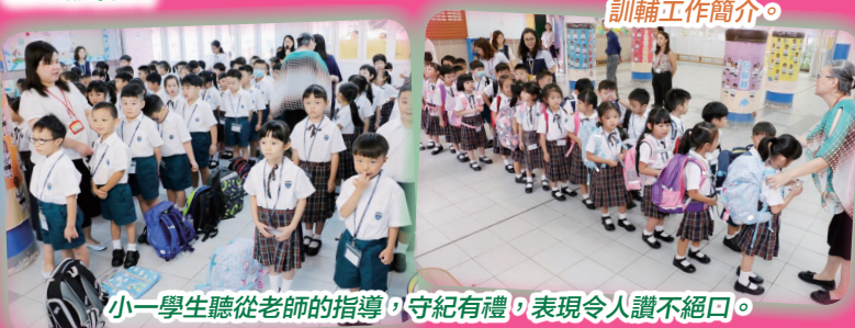
小一學生聽從老師的指導，守紀有禮，表現令人讚不絕口。