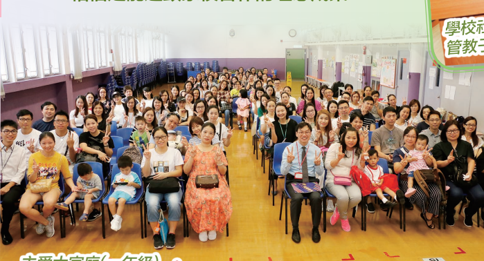
主愛大家庭(一年級)