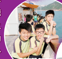
今天的經歷令同學們十分難忘。