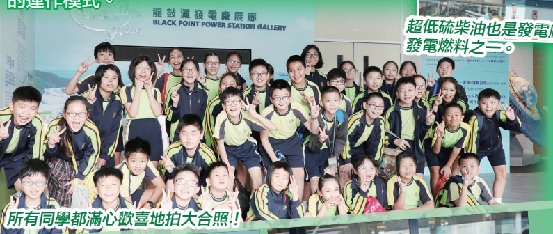
所有同學都滿心歡喜地拍大合照!