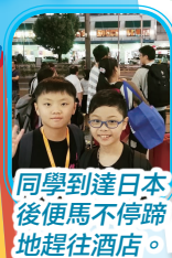
同學到達日本後便馬不停蹄地趕往酒店。

透過比賽，與日本、台灣及韓國優勝隊伍的學生互動，從而認識日本文化，以及學習其他地方學生的機械組裝技術和編程技巧。