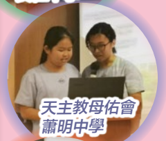
天主教母佑會蕭明中學