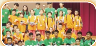
比賽完結後，與各國好手一同拍照留念。

除了比賽，此行更讓學生接觸到日本的科技及文化，有機會與其他亞洲地區的機械人隊進行交流，又可參觀日本的名勝，令他們眼界大開，增長了不少課外知識。