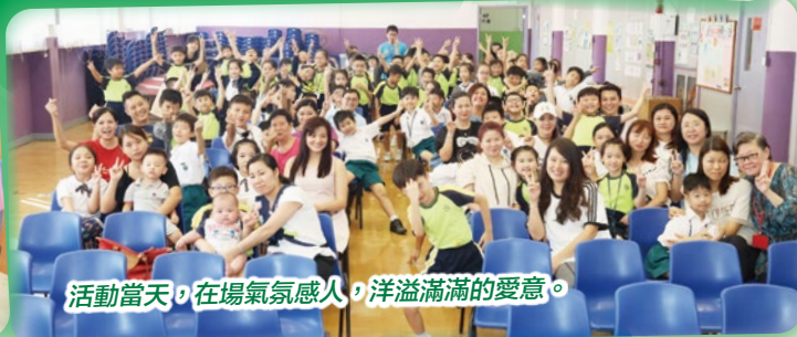
活動當天，在場氣氛感人，洋溢滿滿的愛意。

花式跳繩隊同學逢星期三課後進行練習，由專業教練教授花式跳繩技巧。這項看似普通的運動，只要配合不同花式，加上與其他隊員合作，就成為了變化多端的花式跳繩。花式跳繩可以改善同學手腳協調，建立自信，亦可以增強心肺功能。花式跳繩的樂趣在於只要不怕失敗反覆練習，一定會有進步！