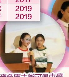
薈色園主辦可風中學