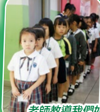
老師教導我們如何排隊，更稱讚我們做得很好呢！