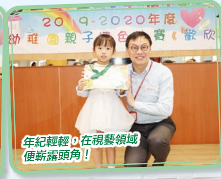
年紀輕輕，在視藝領域便嶄露頭角！