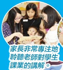
家長非常專注地聆聽老師對學生課業的講解。