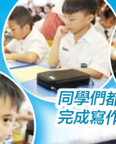
同學們都十分努力完成寫作。