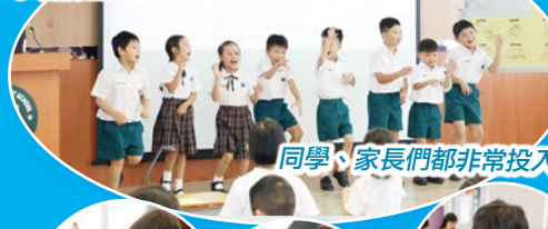
同學、家長們都非常投入，一齊又唱又跳！