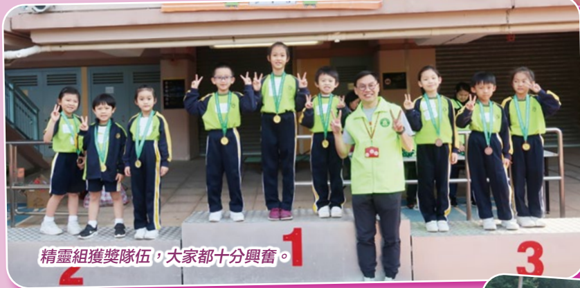
精靈組獲獎隊伍，大家都十分興奮。