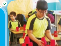
雖然初接觸疊杯，但 同學都十分投入活動， 很快就上手。

花式跳繩隊同學逢星期三課後進行練習，由專業教練教授花式跳繩技巧。這項看似普通的運動，只要配合不同花式，加上與其他隊員合作，就成為了變化多端的花式跳繩。花式跳繩可以改善同學手腳協調，建立自信，亦可以增強心肺功能。花式跳繩的樂趣在於只要不怕失敗反覆練習，一定會有進步！