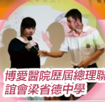
博愛醫院歷屆總理聯誼會梁省德中學

除了本校六年級應屆畢業生外，五十多位家長們亦不遺餘力，陪伴子女出席分享會，細心地聆聽校友的分享，以求為子女揀選合適的中學。