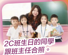
2C班生日的同學 跟班主任合照。