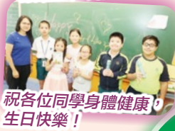
祝各位同學身體健康， 生日快樂！