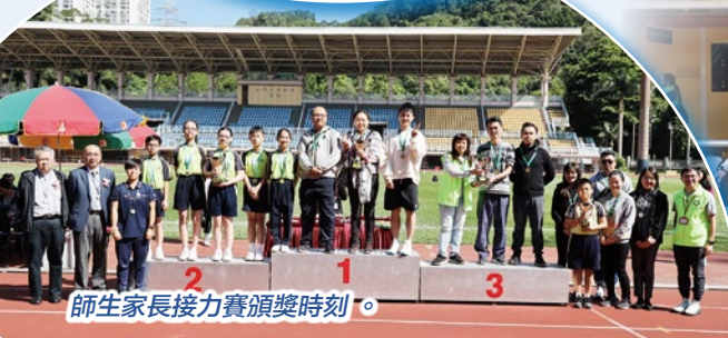
師生家長接力賽頒獎時刻。