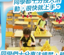
同學們十分專注練習，務 求以最短時間疊好所有杯！