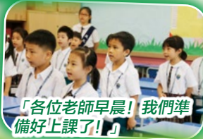
「各位老師早晨！我們準備好上課了！」