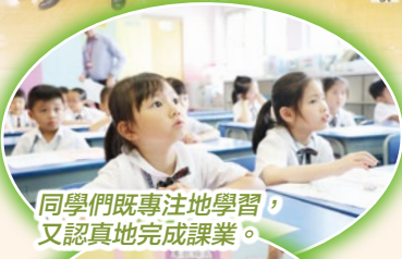
同學們既專注地學習，又認真地完成課業。