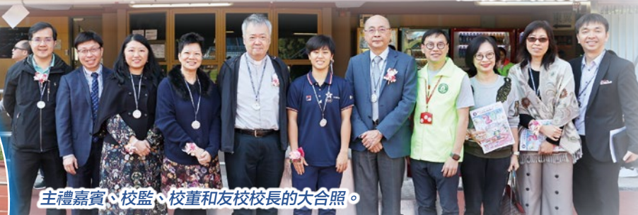
主禮嘉賓、校監、校董和友校校長的大合照。