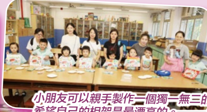
小朋友可以親手製作一個獨一無三的相架。他們很用心填上顏色，希望自己的相架是最漂亮的。