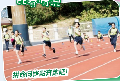
拼命向終點奔跑吧!