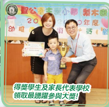
得獎學生及家長代表學校領取最踴躍參與大獎！