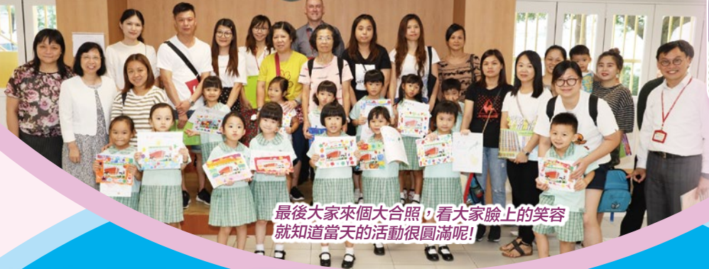
最後大家來個大合照，看大家臉上的笑容就知道當天的活動很圓滿呢！