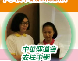
中華傳道會安柱中學