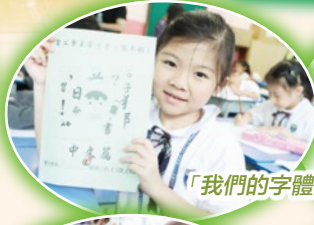
「我們的字體漂亮嗎？」