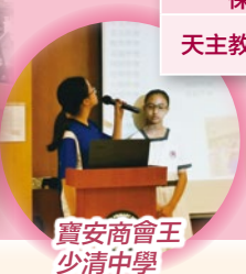
寶安商會王少清中學