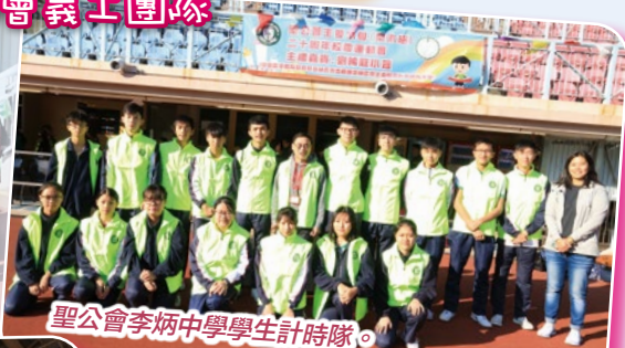
聖公會李炳中學學生計時隊。