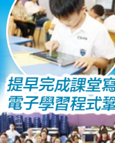
提早完成課堂寫作的同學可以利用電子學習程式鞏固所學的知識。