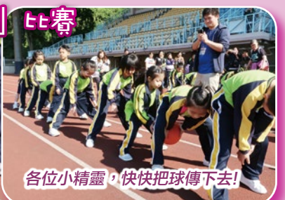
各位小精靈，快快把球傳下去！