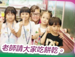
老師請大家吃餅乾。