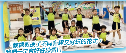
「教練教授了不同有趣又好玩的花式， 我們一定會好好練習！」