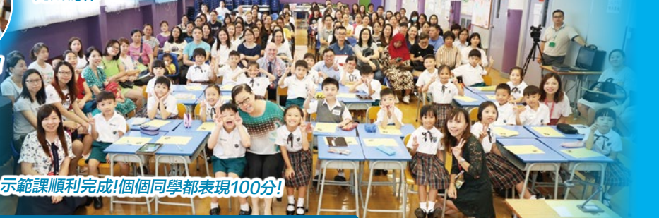
示範課順利完成！個個同學都表現100分！