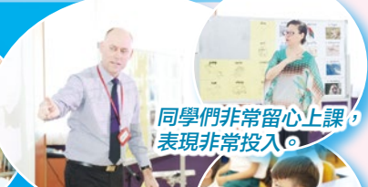
同學們非常留心上課，表現非常投入。