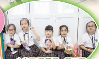
小息了！同學們一同玩耍及吃零食，高興極了！