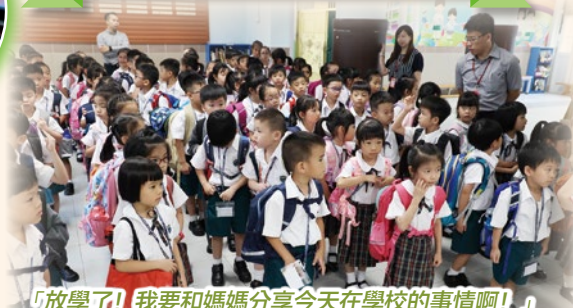
「放學了！我要和媽媽分享今天在學校的事情啊！」