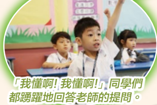
「我懂啊！我懂啊！」同學們都踴躍地回答老師的提問。