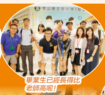
畢業生已經長得比老師高呢！