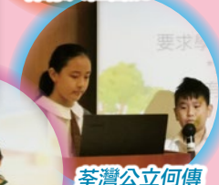
荃灣公立何傳耀紀念中學