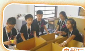
參觀玩具泥膠製造工場。