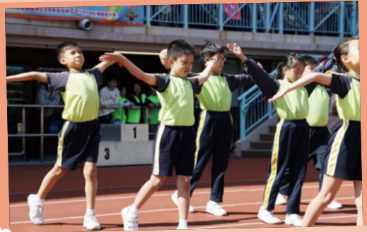
每位健體操的代表都精神抖擻，展現出完美的動作。