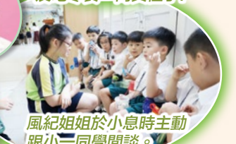
風紀姐姐於小息時主動跟小一同學閒談。