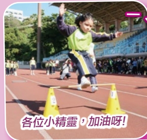
各位小精靈，加油呀！

另一邊廂的小一、小二精靈組競技遊戲也十分激烈，一、二年級的小健兒和家長們都在比賽中全力以赴，表現出色。會場內氣氛熱鬧，各班也為自己的同學歡呼吶喊，親子接力賽更為比賽帶來高潮。最後，由翟校長頒發獎項予各組健兒，學生及家長們都非常開心呢！