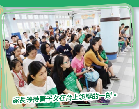
家長等待著子女在台上領獎的一刻。