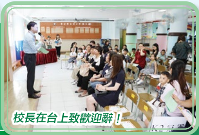
校長在台上致歡迎辭！

幼稚園親子填色比賽暨頒獎典禮於2019年9月21日(星期六)舉行，區內各間幼稚園鼎力支持，使活動得以順利完成。是次填色比賽的主題為「歡欣」，希望參與學生與家長投入在色彩世界中，為本校二十周年校慶添上姿彩！