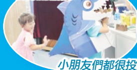
小朋友們都很投入唱遊活動啊！