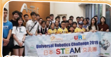
參觀ARTEC在日本的總公司。