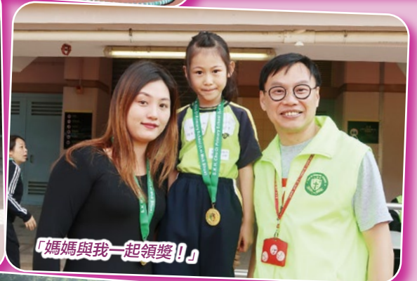
「媽媽與我一起領獎！」