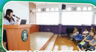
家長們十分專注地聆聽本校各項行政措施及入學須注意事項。