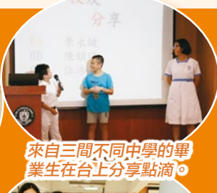
來自三間不同中學的畢業生在台上分享點滴。