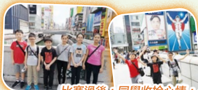
比賽過後，同學收拾心情，到不同的地方參觀。