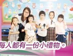
每人都有一份小禮物。