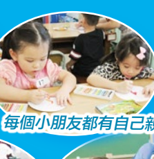
每個小朋友都有自己親手做的紀念品呢！