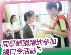
同學都踴躍地參加 繞口令活動。