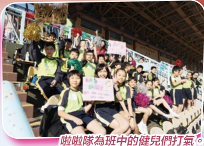
啦啦隊為班中的健兒們打氣。