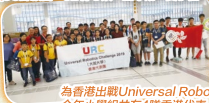
為香港出戰Universal Robotics Challenge 2019 (大阪大學) 今年小學組共有4隊香港代表。