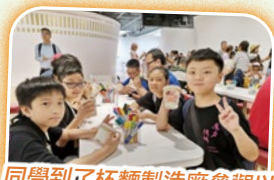
同學到了杯麵製造廠參觀以及製作自己設計的杯麵。