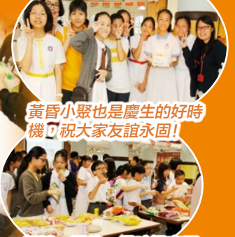
黃昏小聚也是慶生的好時機，祝大家友誼永固！