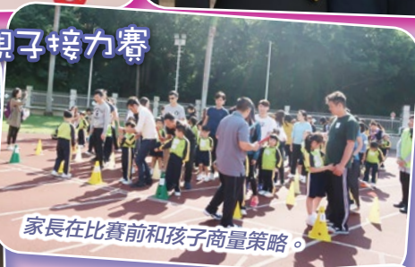
家長在比賽前和孩子商量策略。