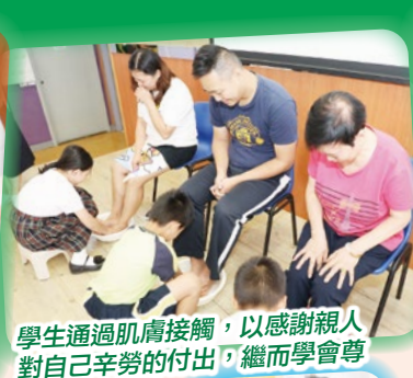
學生通過肌膚接觸，以感謝親人 對自己辛勞的付出，繼而學會尊 重及善待他人。