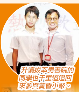
升讀拔萃男書院的同學也千里迢迢回來參與黃昏小聚。

當天的活動十分豐富，先由翟校長為是次活動展開序幕，帶領同學們一起為新的校園生活禱告。接著，三位去屆畢業生逐一分享中學生活的點滴和回顧小學生涯的種種。隨後，同學們把握享用茶點的時間與老師和同學們暢談一番。最後，畢業生們亦紛紛寫下對母校的祝福，把留言貼在壁報板上。本年度的黃昏小聚在既熱鬧也溫馨的氣氛下結束了。