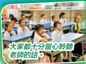
大家都十分留心聆聽老師的話。