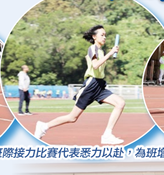
班際接力比賽代表悉力以赴，為班增光!