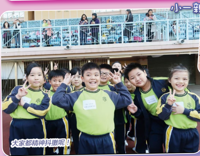
大家都精神抖擻呢！