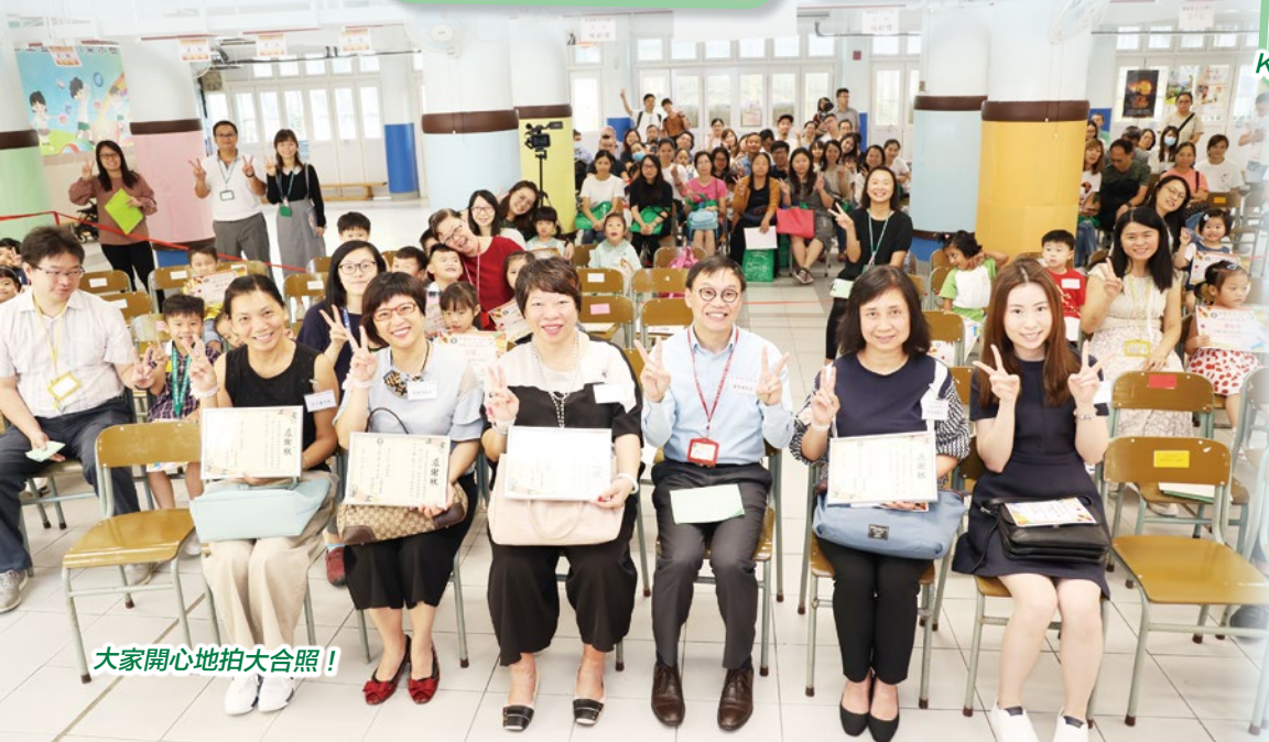
大家開心地拍大合照！