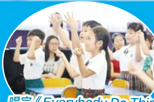
唱完《Everybody Do This Song》，Space Town英語示範課正式開始！

本年度的校園開放日已於2019年9月7日(星期六)舉行，吸引了不少幼稚園及本校的家長到來參觀，從而加深對我 校辦學宗旨及各科課程架構的認識。此外，為了讓家長更了解我 校的英語課程，校園開放日當天還安排了「Space Town」英語課程的示範課。「Space Town」英語課程是一個由教育局及外籍英語教師組推行，以PLP-R/W為藍本，再加以改良的英文課程。「Space Town」英語課程在我校已經第四年推行，此課程生動有趣，深受老師、家長及學生歡迎，亦能讓學生發掘到學習英語的樂趣！