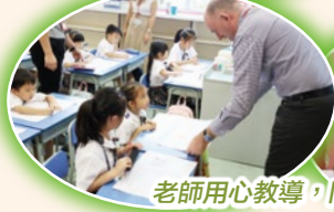
老師用心教導，同學們虛心地學習。