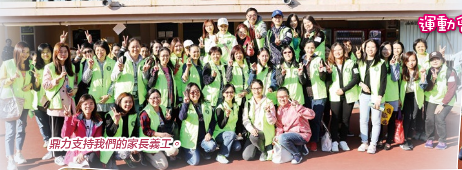
鼎力支持我們的家長義工。