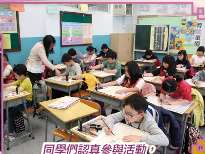
同學們認真參與活動，老師亦耐心予以指導。