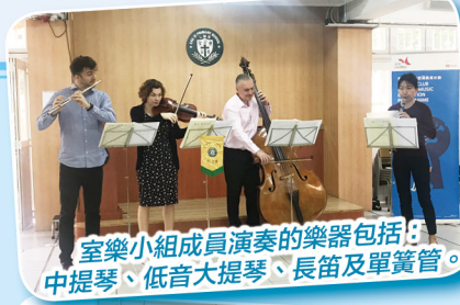
室樂小組成員演奏的樂器包括：中提琴、低音大提琴、長笛及單簧管。

於2019年2月25日(星期一)，「賽馬會音樂密碼教育計劃」的室樂團來到本校進行一場音樂會。幾位樂手為學生介紹他們演奏的樂器，及後更親身表演。樂手以莫札特的《小夜曲》成為音樂會的序曲，接着便為我們演奏多首耳熟能詳的樂曲，包括：《傻豹》主題曲，他們的演奏不但活潑，加上悠揚的音樂，實在是繞樑三日。在音樂會的中段，室樂團更邀請了兩位同學做指揮，兩位六年級的同学勇於嘗試，相信他們在這次的經驗中獲益良多。