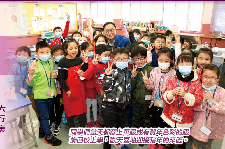
同學們當天都穿上華服或有賀年色彩的服飾回校上學，歡天喜地迎接豬年的來臨。

當天午膳後，同學們皆於課室內進行書法比賽。小四至小六學生參與班際毛筆書法比賽，而小一至小二學生除於課堂上進行了硬筆書法比賽外，還製作了一個賀年裝飾。同學們都在課室裏剪剪貼貼，用心製作獨一無二的賀年裝飾，大家都樂也融融。