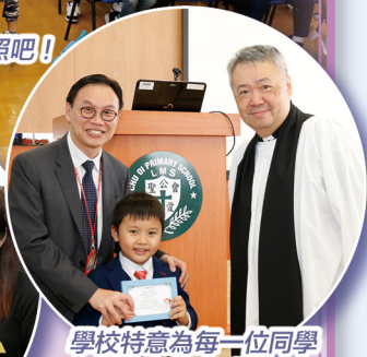
學校特為每一位同學送上一份小禮物。