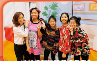
猜猜我們扮演什麼角色?