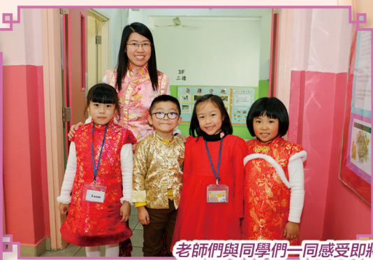
老師們與同學們一同感受即將過新年的歡樂。