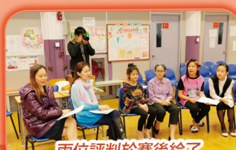
兩位評判於賽後給了同學們很多寶貴的意見。