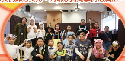
英語話劇角色大合照。