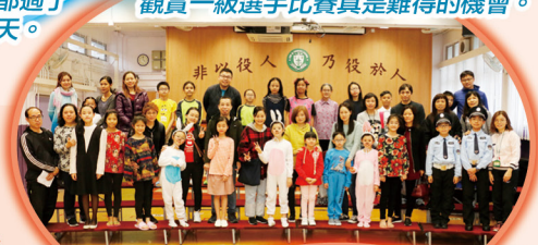
家長們鼎力支持，到場欣賞同學們的演出。

學校本年度參加了「香港學校戲劇節2018/2019」粵語話劇及英文話劇表演。英文話劇於2019年2月25日(星期一)進行，演出的劇目為《Cinderella's Birthday Party》，而粵語話劇則於2019年3月7日(星期四)進行，演出的劇目為《小白生日會》。同學們於演出前進行了多次的綵排，於表演當天均能自信滿滿地演繹劇中的角色，得到評判的肯定。而參加粵語、英文話劇，學生除了可學習到如何揣摩角色的神態、化妝技巧及服飾配搭外，亦可提升說話能力及自信心，真的是獲益良多。