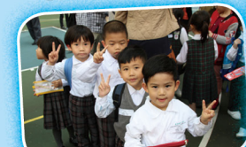
參與比賽的幼稚園學生準備比賽，大家都顯得精神奕奕。