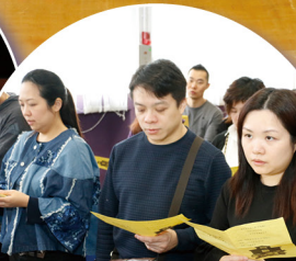
家長的參與充分顯示出他們對子女及學校的支持。家長們，謝謝你們！