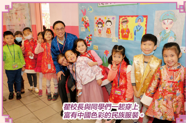
翟校長與同學們一起穿上富有中國色彩的民族服裝。