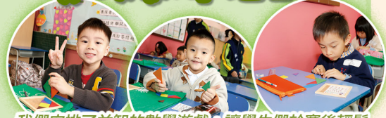
我們安排了益智的數學遊戲，讓學生們於賽後輕鬆一番，同學們都十分投入，樂在其中。