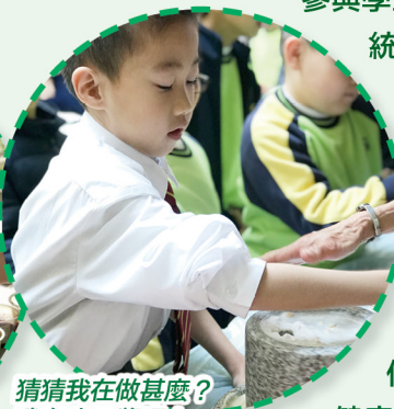
猜猜我在做甚麼？我在磨豆漿呀！