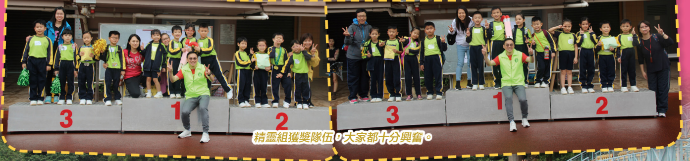
精靈組獲獎隊伍，大家都十分興奮。