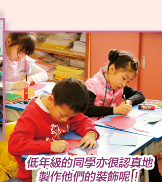
低年級的同學亦很認真地製作他們的裝飾呢！