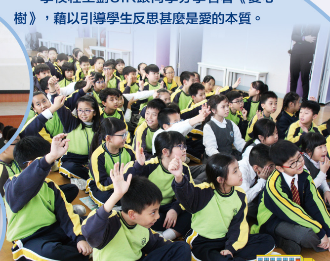
同學們均想抒發己見。