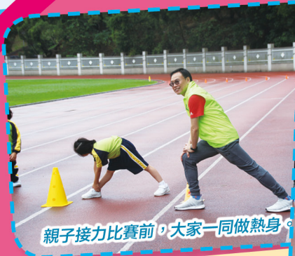
親子接力比賽前，大家一同做熱身。

當主看台的賽事進行得如火如荼，在另一邊廂的副看台的賽事也十分激烈。一、二年級的小健兒和家長們都在比賽中全力以赴，表現出色。會場內氣氛熱鬧，各班也為自己的同學歡呼吶喊，親子接力賽更為副看台帶來精彩又刺激的氣氛。最後，由翟校長頒發獎項予各組健兒，學生及家長們都非常開心呢！