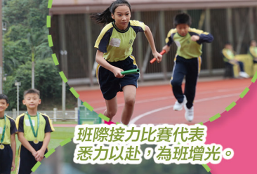
班際接力比賽代表悉力以赴，為班增光。