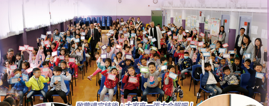
啟蒙禮完結後，大家來一張大合照吧！