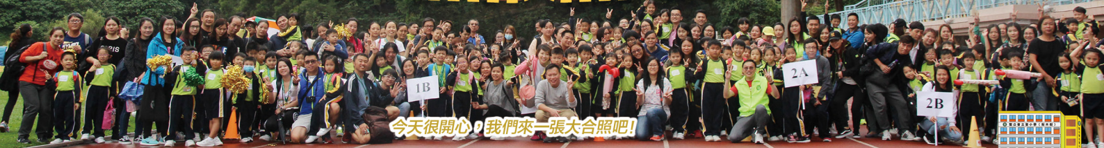
今天很開心，我們來一張大合照吧！