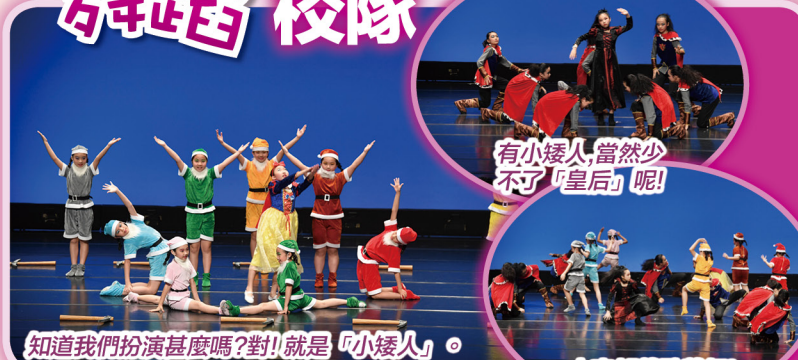
有小矮人，當然少不了「皇后」呢!