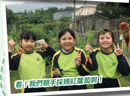
看！我們親手採摘紅蘿蔔啊！