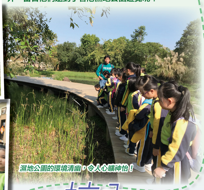
濕地公園的環境清幽，令人心曠神怡！