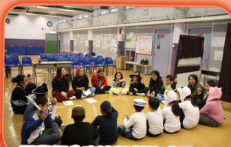
同學們分享演話劇的感受。