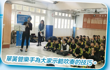
單簧管樂手為大家示範吹奏的技巧。