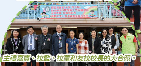
主禮嘉賓、校監、校董和友校校長的大合照。