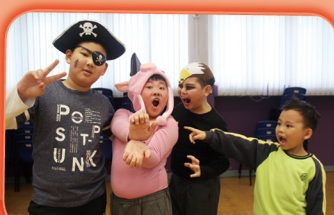
在英語話劇組，我認識到很多新朋友。