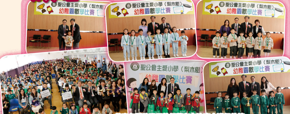
恭喜各間幼稚園的得獎者在比賽中獲得佳績。