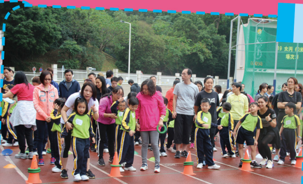
家長在比賽前和孩子商量策略。