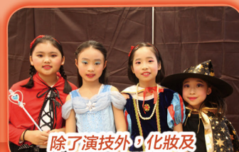
除了演技外，化妝及服飾也很重要呢!