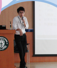
劉SIR跟同學分享正確的價值觀。