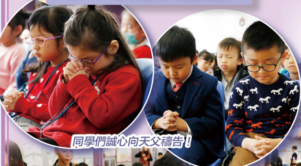
同學們誠心向天父禱告！