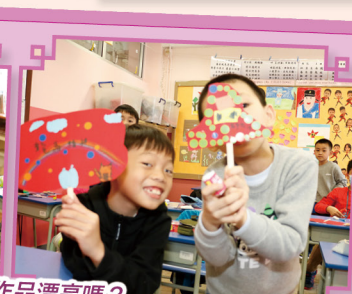
我們的作品漂亮嗎？