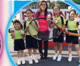
老師和同學都過了愉快的一天。