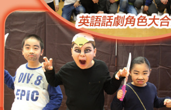
我們是老鷹和強盜，是否很害怕?