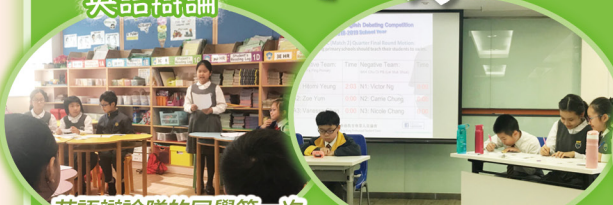
英語辯論隊的同学第一次參加比賽也毫不怯場。