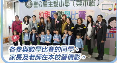
各參與數學比賽的同學、家長及老師在本校留倩影。