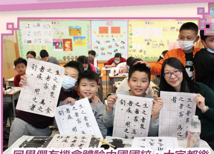
同學們有機會體驗中國國粹，大家都樂在其中，師生們還一同分享成果呢！