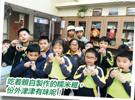
吃着親自製作的糯米糍，份外津津有味呢！！