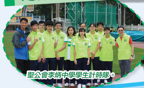
聖公會李炳中學學生計時隊。