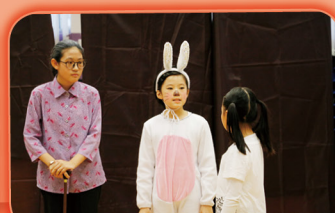
能扮演不同的角色，很有趣啊!