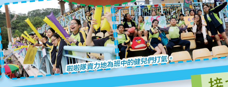
啦啦隊賣力地為班中的健兒們打氣。