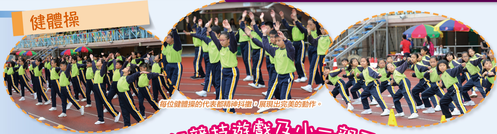
每位健體操的代表都精神抖擻，展現出完美的動作。