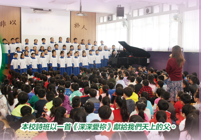
本校詩班以一首《深深愛祢》獻給我們天上的父。