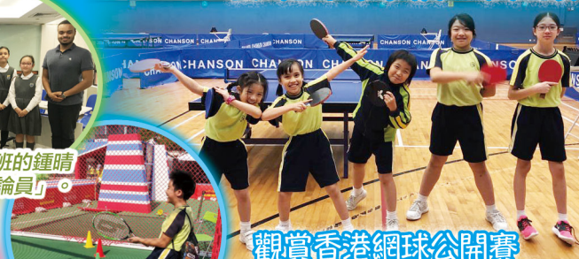
觀賞香港網球公開賽