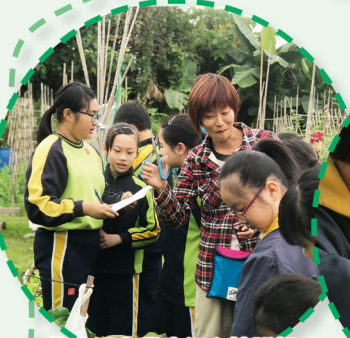
工作人員向學生細心地講解不同植物的生長特性。

本校與「聖公會麥理浩夫人中心」協辦兩次「區本戶外學習活動」。第一次活動：小四至小六參與學生於2019年1月16日(星期三)進行「傳統紮染體驗學習日」，他們嘗試使用天然材料體驗紮染及印染工藝，亦參觀有機種植場，不但提升他們的環保意識，更讓他們在過程中學習與人相處的技巧。第二次活動：小一至小三參與學生於2019年1月17日(星期四)進行「舌尖上的學習之旅」，透過親手製作傳統小食及參觀食品工場，從而學習健康飲食的知識及認識本地的飲食文化。此外，當日他們還到了香港濕地公園遊覽呢！