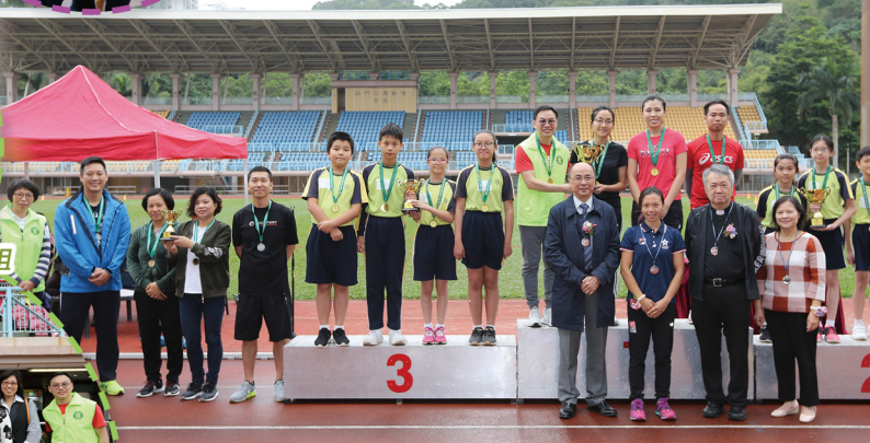
師生家長接力賽頒獎時刻。