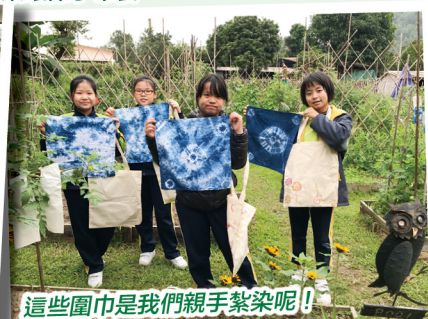
這些圍巾是我們親手紮染呢！！