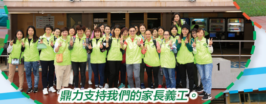
鼎力支持我們的家長義工。