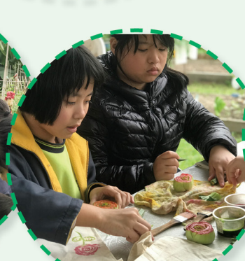
我們利用秋葵、白菜、紅菜頭等來印染環保小布袋。