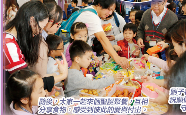
隨後，大家一起來個聖誕聚餐，互相分享食物，感受到彼此的愛與付出。