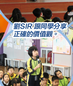
同學分享自己的看法。