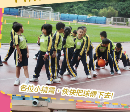
各位小精靈，快快把球傳下去！