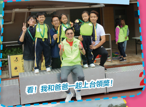
看！我和爸爸一起上台領獎！