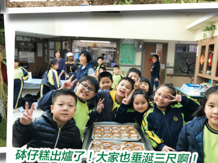
砵仔糕出爐了！大家也垂涎三尺啊！