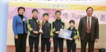
在此比賽中0四位同學成績優異，更獲得了團體冠軍。