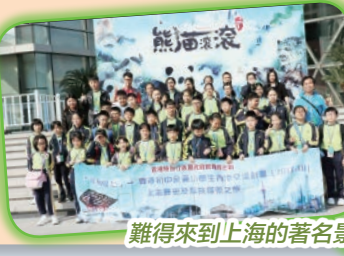
難得來到上海的名勝景點，我們一同大合照吧！