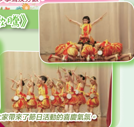
小朋友穿上喜氣洋洋的舞衣，配以抑揚的鼓聲，為大家帶來了節日活動的喜慶氣氛。