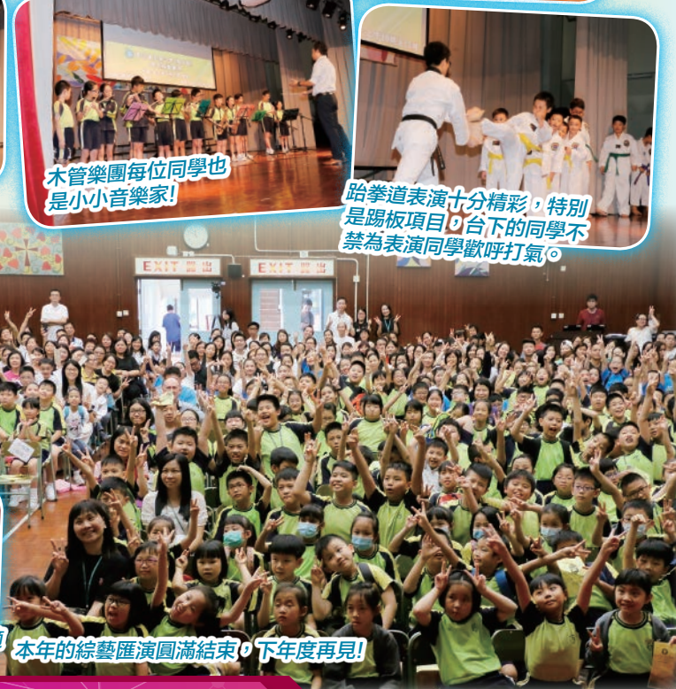
本年的綜藝匯演圓滿結束，下年度再見！