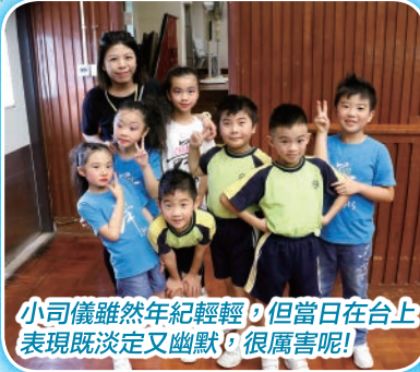
小司儀雖然年紀輕輕，但當日在台上表現既淡定又幽默，很厲害呢！

學生能夠在舞台上展現學習成果，令他們可以發掘自己的才能。希望下年度有更多的同學能夠站到舞台上盡展所長！