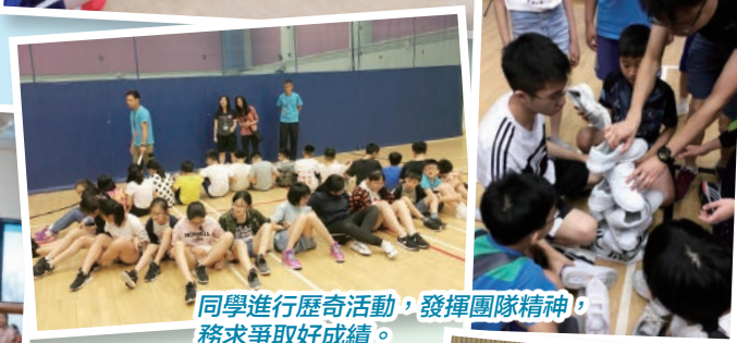
同學進行歷奇活動，發揮團隊精神，務求爭取好成績。