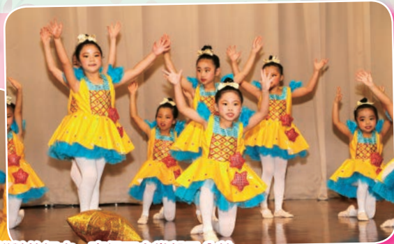
學生充滿節奏地扭動着身體，功架十足，加上色彩鮮豔的舞衣，贏得不少掌聲及分數。