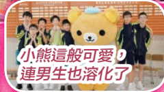
小熊這般可愛，連男生也溶化了