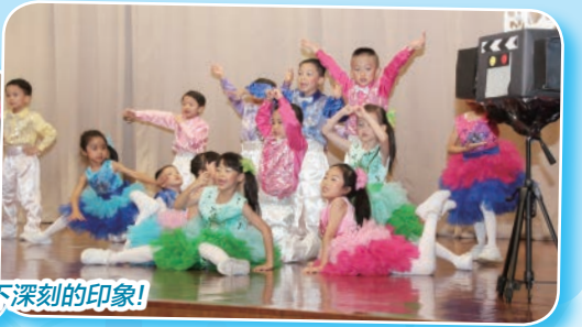
學生將舞台變作片場，變身舞蹈明星，令台下觀眾留下深刻的印象！