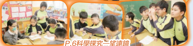
P.6科學探究一望遠鏡