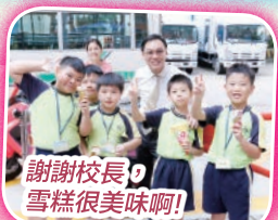
謝謝校長雪糕很美味啊!

為鼓勵學生積極投入參與活動，為他人服務，發揮所長及建立學生的良好品德，本年度訓育組推行「彩虹獎勵計劃」，以獎勵學生在各範疇的突出表現及良好品德。此活動全年進行，老師及家長均可以給予印章以表揚學生的正面行為。學生可以印章兌換獎券，於2018年7月11日(星期三)的全校獎勵日中參與活動。當天場面熱鬧，學生除了可以換取雪糕、爆谷、糖蔥餅、麥芽糖餅乾及扭蛋外，亦可玩遙控車、參與攤位遊戲及與人氣卡通人物拍照，學生們也展露出燦爛的笑容，一同享受本年度努力的成果呢！