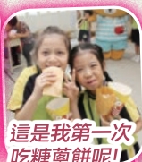
這是我第一次吃糖蔥餅呢!