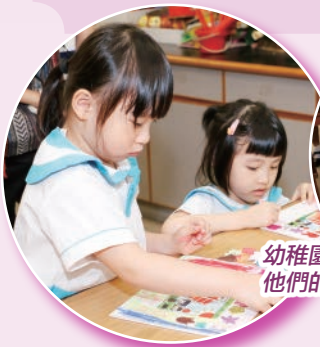
幼稚園學生對製作小手工充滿興趣，他們的作品都很有水準呢!