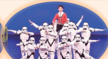
舞蹈員化身成為機械人。