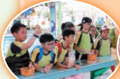
聚精會神，一擊即中