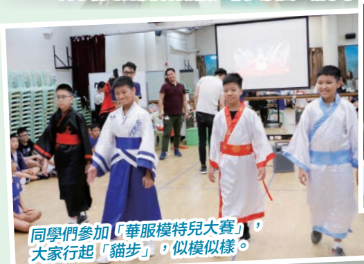
同學們參加「華服模特兒大賽」，大家行起「貓步」，似模似樣。