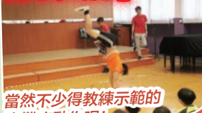
當然不少得教練示範的高難度動作呢！