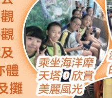
乘坐海洋摩天塔欣賞美麗風光