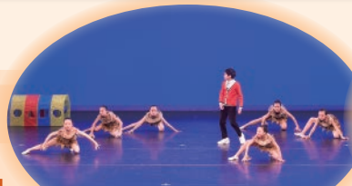
舞蹈員成為原始時代的恐龍和土人時，表現相當專業。

本年度學校舞蹈校隊參加了第54屆學校舞蹈節，於現代舞(小學高年級組)中取得甲等獎，另於第46屆全港公開舞蹈比賽中，取得爵士舞(少年組)的銀獎。本校舞蹈隊能奪得如此佳績，小小舞蹈員實在功不可沒。同學們除了要不斷接受艱苦的舞蹈技巧訓練外，更要與同伴們學習互相體諒，互相合作，互補不足，才能充份發揮團隊精神。同學們能取得如此優異的成績，實在可喜可賀！