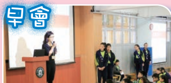
老師在普通話早會時段為同學分享故事，同學們都專心地聆聽。