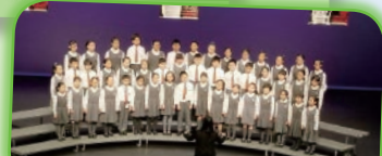
高年級組合唱團每位團員在比賽中投入地唱出參賽歌曲《In dreams》。

本校合唱團、手鐘隊及木管樂團均參加了「聯校音樂大賽2018」，低年級組合唱團及木管樂團獲得銀獎，而高年級組合唱團及手鐘隊則獲得銅獎，各隊也獲得良好的成績，令同學大為鼓舞，果然沒有白費一直以來的努力啊！