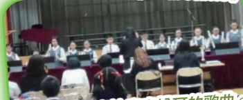
手鐘隊隊員認真地奏出悅耳的歌曲。