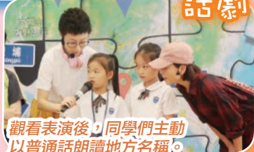
觀看表演後，同學們主動以普通話朗讀地方名稱。