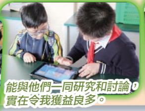
能與他們一同研究和討論，實在令我獲益良多。