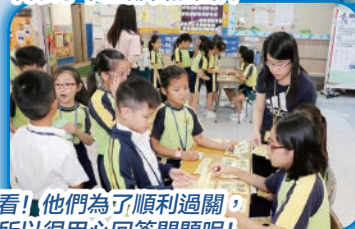
看！他們為了順利過關，所以很用心回答問題呢！