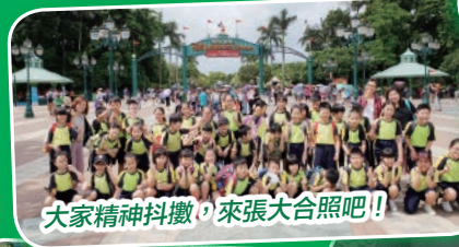
大家精神抖擻，來張大合照吧!