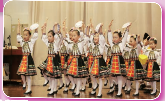
小朋友穿上羅馬尼亞的民俗服裝，扮演農家孩子，維肖維妙，十分可愛！