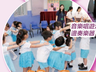
音樂唱遊活動充滿歡樂的氣氛，學生們邊唱歌，邊奏樂器，邊遊戲，真開心啊!