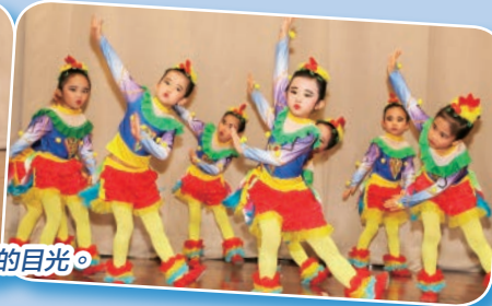
小朋友化身小雞裝扮，配合可愛的舞步，吸引了評判和觀眾的目光。