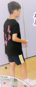
「課業展覽」新增設STEM攤位，幼稚園家長都很感興趣，本校老師及學生積極為家長作示範及解說。