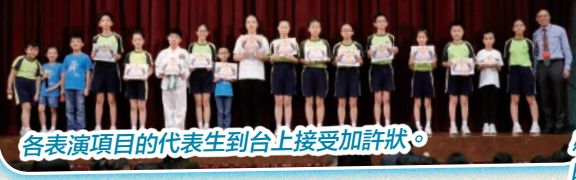
各表演項目的代表生到台上接受加許狀。