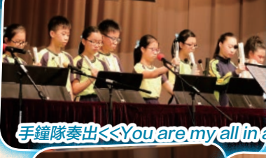
手鐘隊奏出《You are my all in all》一曲讚頌上帝，聲音清脆悅耳。