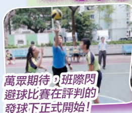
萬眾期待，班際閃避球比賽在評判的發球下正式開始！