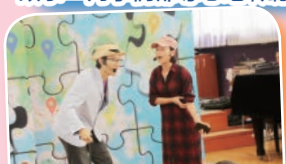
劇團把普通話融入生活當中，以生動、有趣的方式演繹，使同學們獲益良多。