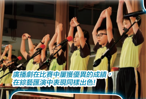
廣播劇在比賽中屢獲優異的成績，在綜藝匯演中表現同樣出色！