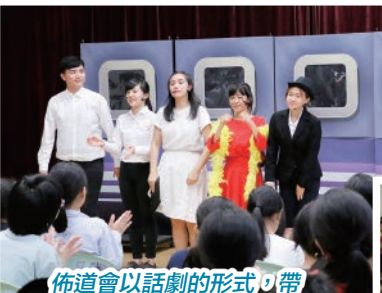
佈道會以話劇的形式，帶出人生的旅途充滿挑戰、夢想、希望、離別……希望同學們學會善待旅途上遇到的所有旅客，找出自己身上的閃亮點。