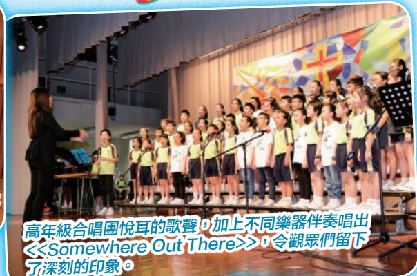
高年級合唱團悅耳的歌聲，加上不同樂器伴奏唱出《Somewhere Out There》，令觀眾們留下了深刻的印象。