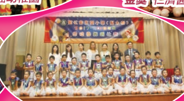
銅獎 路德會恩石幼稚園