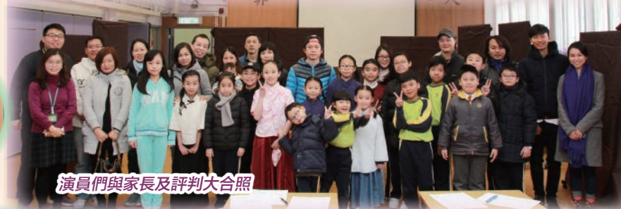
演員們與家長及評判大合照