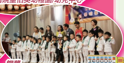
銅獎 聖公會荊冕堂葵涌幼稚園