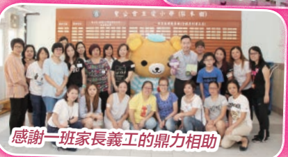
感謝一班家長義工的鼎力相助