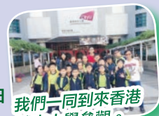
我們一同到來香港城市大學參觀。

18位四至六年級學生參加由「一家一網e學習」上網學習支援—「有機上網」計劃資助的舉辦「師友計劃」，學生於上學期課外活動時段學習了製作電子學習檔案、一小時編程及360°影片拍攝；並於20/1/2018(星期六)到香港城市大學參觀，體驗大學的生活。