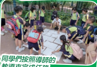
同學們按照導師的教導來完成任務