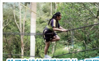
除了安排的團體活動外，同學們也盡情地享用營內的設施。