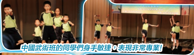
中國武術班的同學們身手敏捷，表現非常專業！