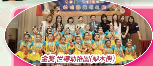
金獎 世德幼稚園(梨木樹)