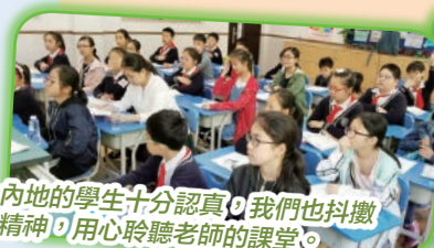
內地的學生十分認真，我們也抖擻精神，用心聆聽老師的課堂。

於2018年4月25日(星期三)至4月27日(星期五)，本校約80位學生跟隨老師到上海進行交流活動。在這三天，本校學生跟內地學生一同上課及互相分享，又到了上海著名的電視塔、外灘、藝術博物館等地進行參觀，此行實在令學生擴闊視野，對祖國認識更多。