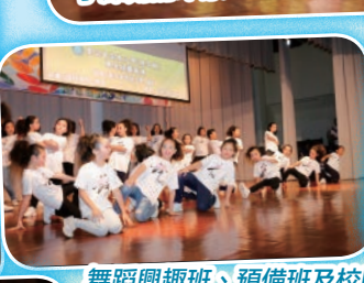
舞蹈興趣班、預備班及校隊的同學們在台上十分落力演出，令全場報以熱烈的掌聲，不枉他們平日努力的練習啊！