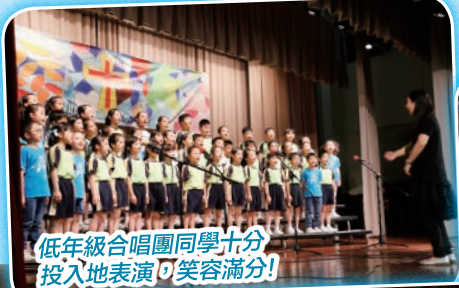
低年級合唱團同學十分投入地表演，笑容滿分！