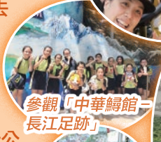
參觀「中華鱔館—長江足跡」