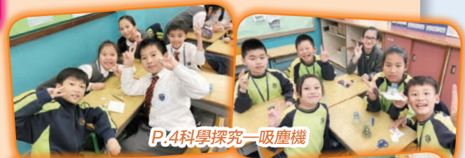
P.4科學探究一吸塵機

本年度常識科為學生舉辦了多元化的學習活動，當中以探究活動及參觀活動為主。學生均可以在常識課中通過科學探究活動而獲得知識，此活動有助提升他們的學習興趣，同時亦能訓練他們的共通能力，令學生從學習中得到更多。