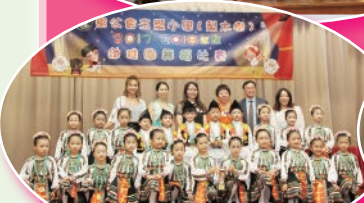
銀獎 聖公會荊冕堂士德幼稚園