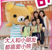
大人和小朋友都喜愛小熊