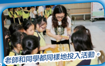
老師和同學都同樣地投入活動。