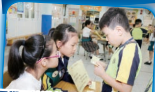
同學正按遊戲要求，流暢地朗讀出卡片內的文字內容。