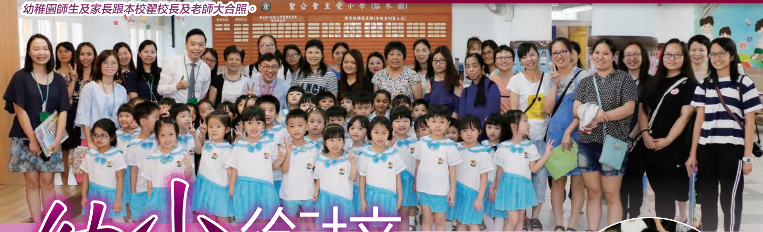
聖公會主愛小學 (梨木樹)