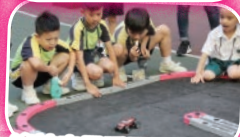
遙控車最受男同學歡迎