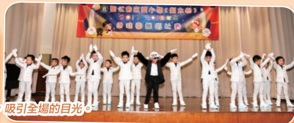
小朋友穿著帥氣的西裝，擺出瀟灑的姿勢，吸引全場的目光。