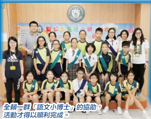
全賴一群「語文小博士」的協助，活動才得以順利完成。