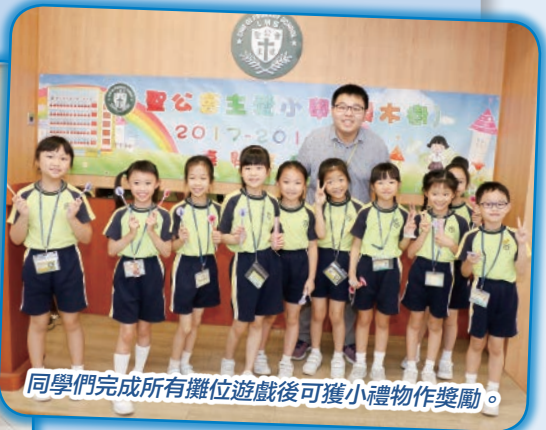
同學們完成所有攤位遊戲後可獲小禮物作獎勵。