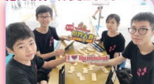
隊員有幸參與三年一度的魔力橋世界賽，大家都積極備戰，務求爭取好成績。