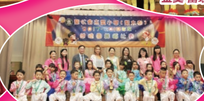
銀獎 荃灣商會邱健峰幼稚園