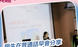
學生在普通話早會分享自己的閃亮點。