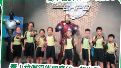
看!我們跟鐵甲奇俠一起出動。