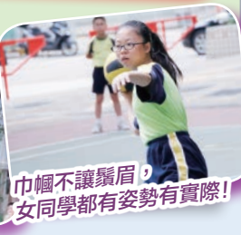
巾幗不讓鬚眉，女同學都有姿勢有實際！