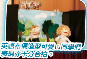
英語布偶造型可愛，同學們表現亦十分合拍。