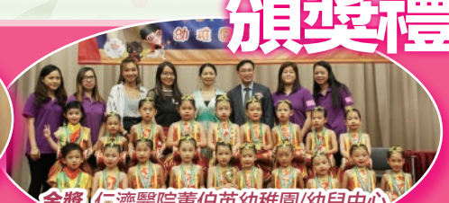
金獎 仁濟醫院董伯英幼稚園/幼兒中心