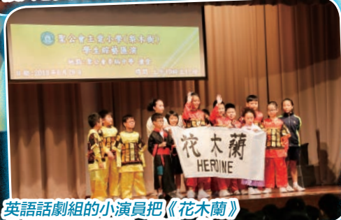
英語話劇組的小演員把《花木蘭》的故事以英語演繹，別具一格。