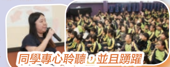
同學專心聆聽，並且踴躍回答講者的提問。

2018年4月10日(星期二)路德會賽馬會海濱花園綜合服務中心於本校為四至六年級學生舉行「網絡欺凌」及「網絡罪行」講座，讓學生能透過講座認識一些網絡資訊素養，學習如何正確使用網站。