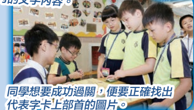
同學想要成功過關，便要正確找出代表字卡上部首的圖片。