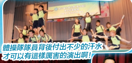
體操隊隊員背後付出不少的汗水，才可以有這樣厲害的演出啊！