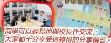
同學可以輕鬆地與校長作交流，大家都十分享受這難得的分享機會。

2018年4月23日(星期一)為全校閱讀日，當天同學可以打扮成自己喜愛的人物，分享閱讀的樂趣之餘，更可以於同學前介紹自己心愛的圖書。