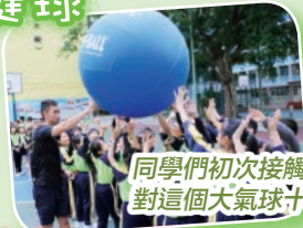
同學們初次接觸「健球」活動，對這個大氣球十分感興趣。