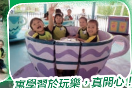
寓學習於玩樂，真開心!