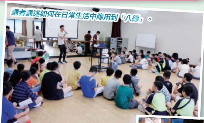
講者講述如何在日常生活中應用到「八德」。

6月13日至15日三天，本校為應屆畢業生於曹公潭戶外康樂中心舉行畢業營。是次活動的主題是「獨立自主，勇敢面對新挑戰」。三天的活動非常豐富，首天邀請了保良局方樹福堂兒童及青少年發展中心為學生講述論語八德；第二天早上進行歷奇活動，晚上舉行佈道會；第三天，讓學生自由自在地享用營地活動。