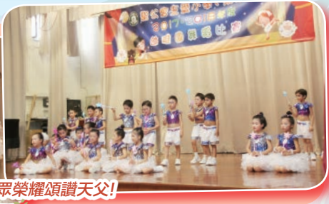
學生透過舞蹈這種身體語言，向台下觀眾榮耀頌讚天父！